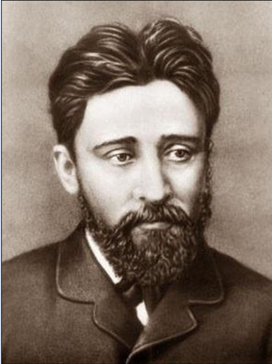
Всеволод Михайлови ч Гаршин