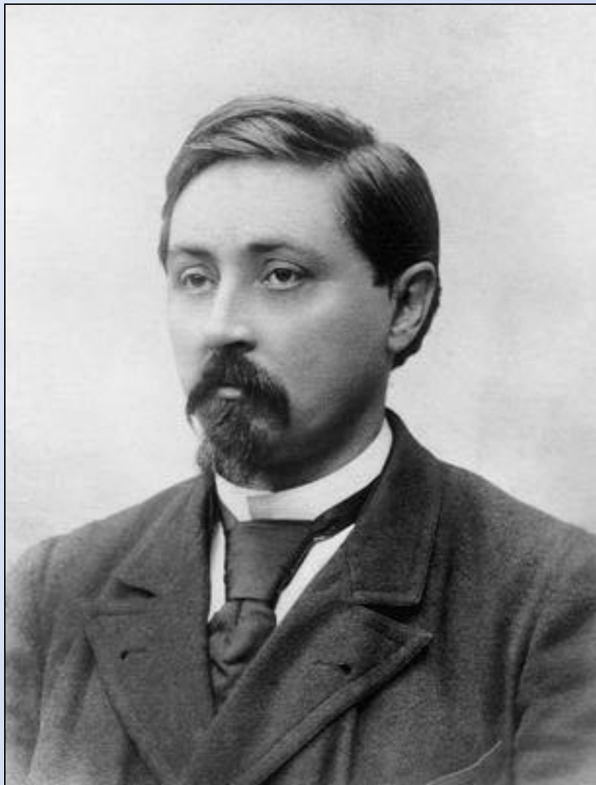
Дмитрий Наркисович Мамин- Сибиряк