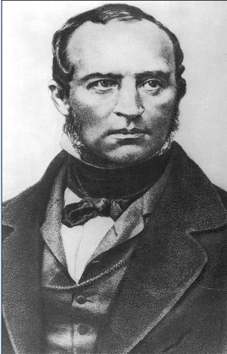
Владимир Фёдорович Одоевский