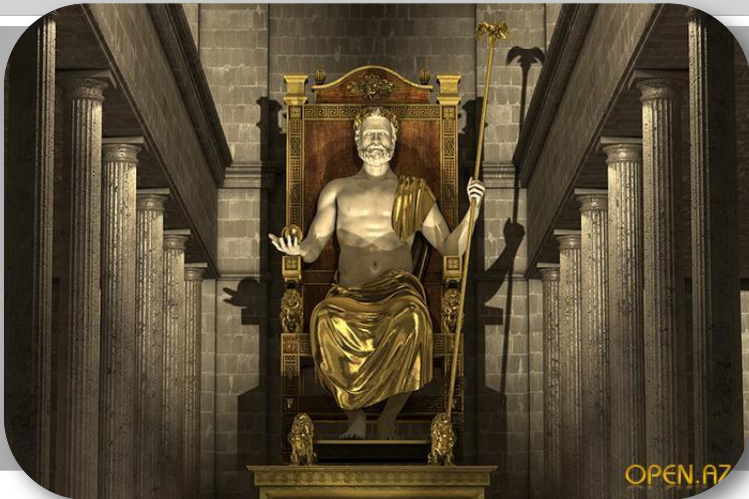
Статуя Зевса в Олимпии. Греция. Олимпия. V век до н.э.