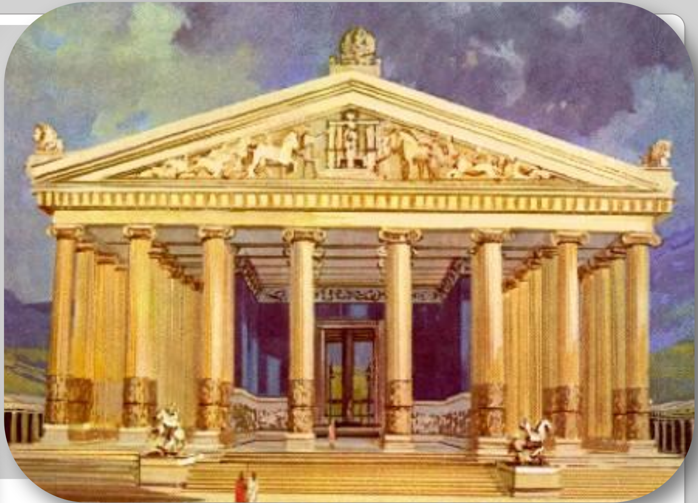
Храм Артемиды в Эфесе. Турция. 550 г. до н.э.