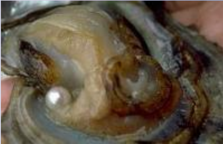
МОЛЛЮСК - ЖЕМЧУЖНИЦА