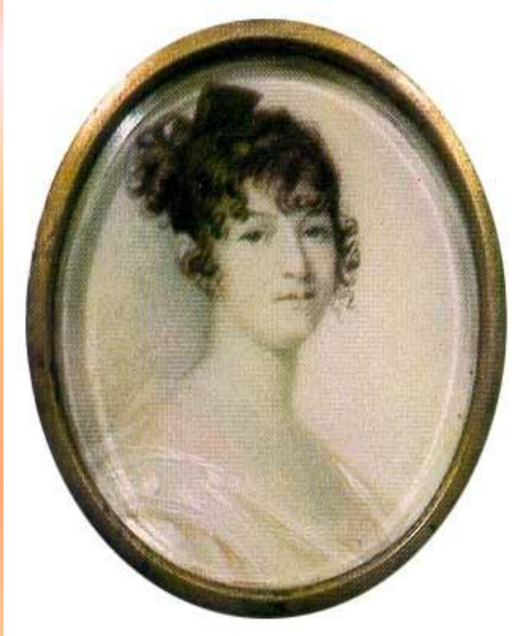
Н.О. Пушкина. 1800-е гг.

Мать, Надежда Осиповна , приходилась внучкой арану Петра I, впоследствии русскому генералу Ганнибалу.