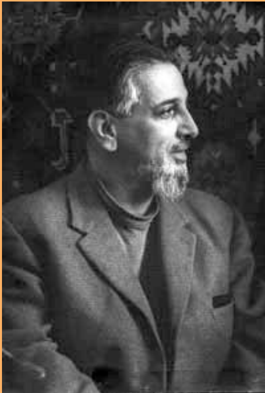
Виктор Ефимович Ардов (писатель-сатирик, драматург, сценарист)