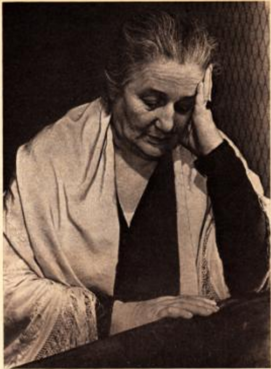
А. А. Ахматова. 1960

В этой жизни я немного видела, Только пела и ждала.