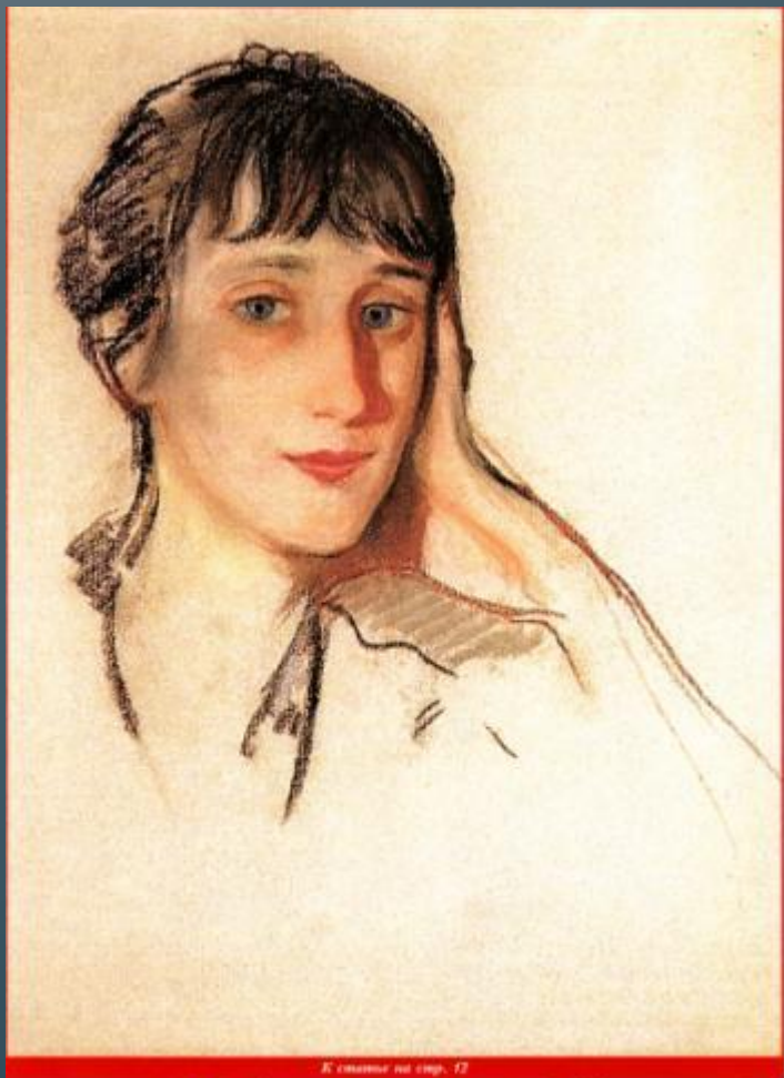
З.Е.Серебрякова. Портрет А.Ахматовой. 1922