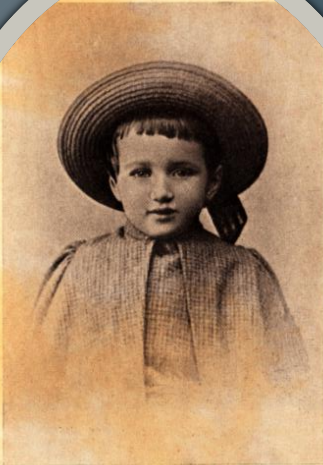
А. А. Ахматова в детстве. 1894

1890 -1905. Детские годы прошли в Царском Селе. Училась в женской Царскосельской гимназии.