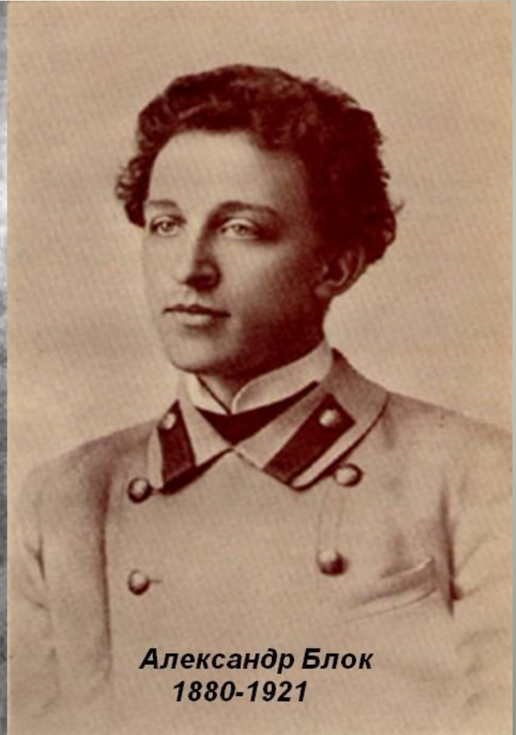
Александр Блок 1880-1921