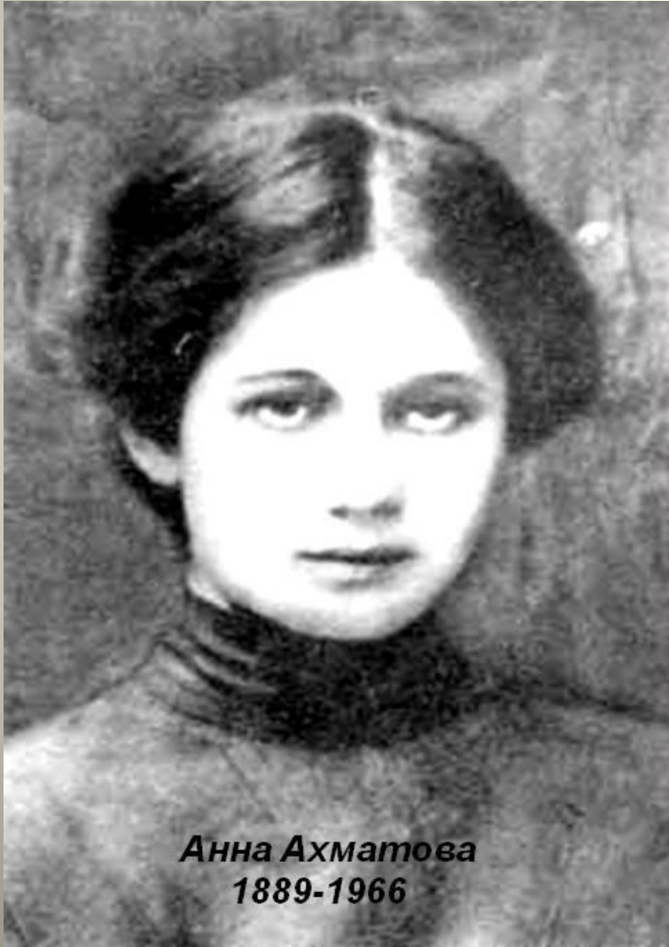
Анна Ахматова 1889-1966

Однако после смерти поэта Ахматова не раз в своих мемуарах возвращалась к этой теме, развеивая все слухи о «чудовищной страсти к Блоку».