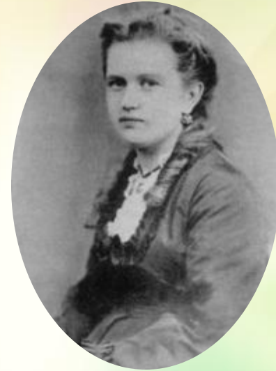
Александра Львовна Мать А.Н.Толстого