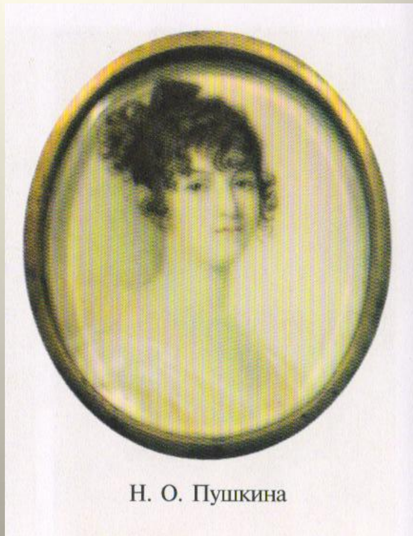
Н. О. Пушкина

Мать Пушкина была внучкой знаменитого Ибрагима Ганнибала. Она была красива. Характер имела самый неровный, с резкими сменами настроений. Любимцем ее был младший сын Лев. В Александре мать раздражало все: упрямство, неповоротливость, его непонятная сложность.