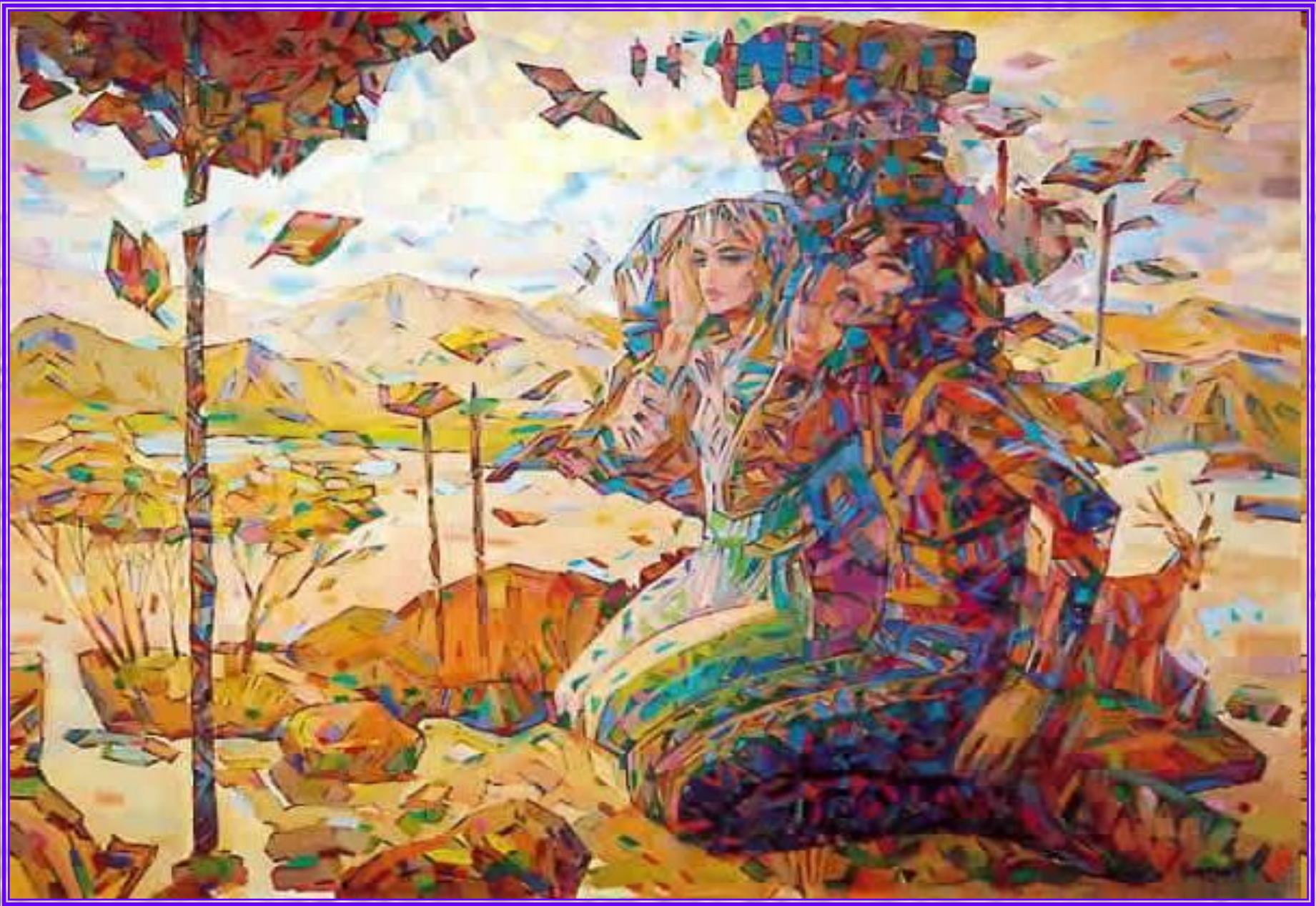
«ЭХО». Мир многогранен, полон разных звуков и