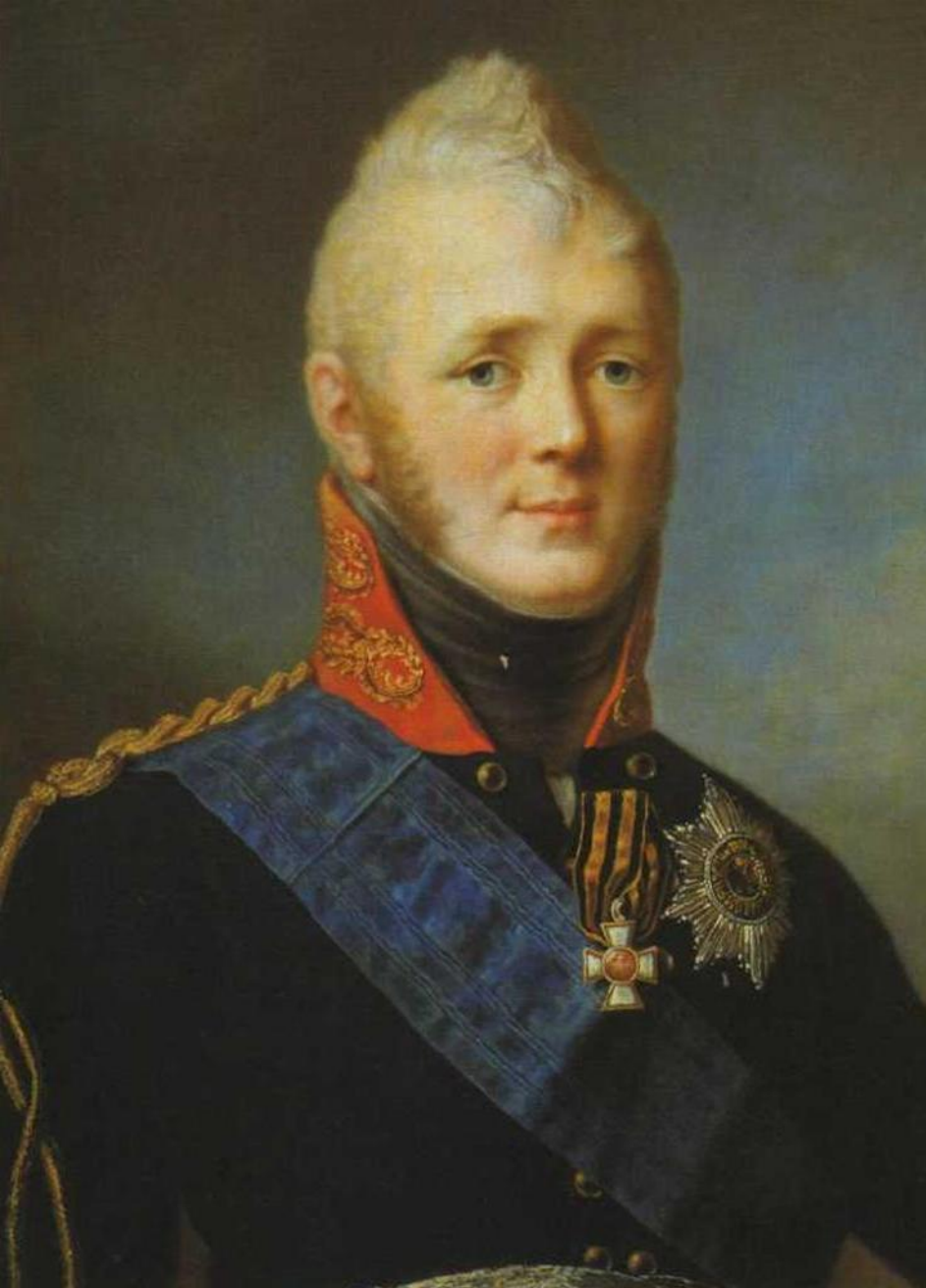
Император Александр I