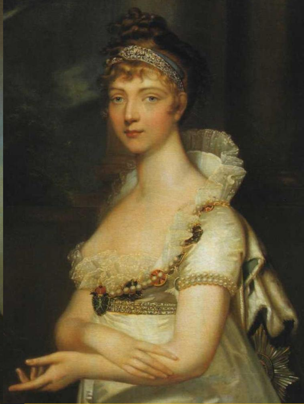
Императрица Елизавета Алексеевна