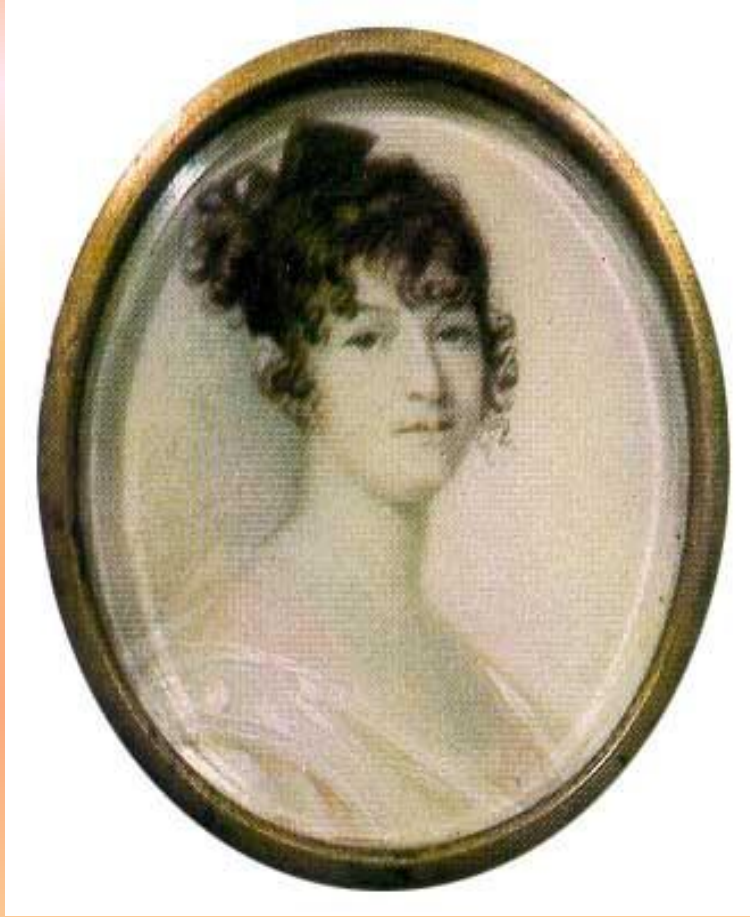
Н.О. Пушкина. 1800-е гг.

Мать, Надежда Осиповна , приходилась внучкой арану Петра I, впоследствии русскому генералу Ганнибалу.