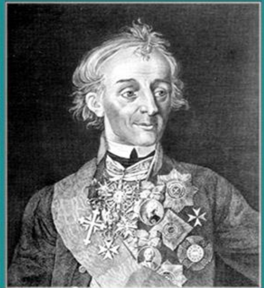
Field Marshall Count Alexander Vasilievich Suvorov Rimniksky