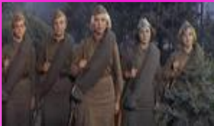
автор проекта: Сенькина Виктория, 7б класс МОУ-СОШ

У каждой из героинь свой счёт к врагу, но на первом месте, наверное, не столько месть, сколько желание победить, и движет ими не только любовь к близким, которых они защищают, но и любовь к Родине.