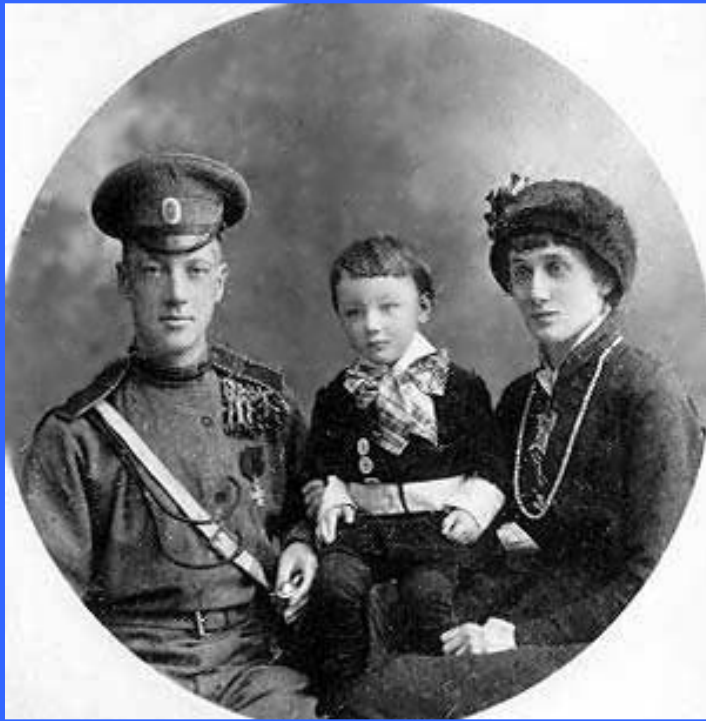
Ахматова и Гумилев с сыном