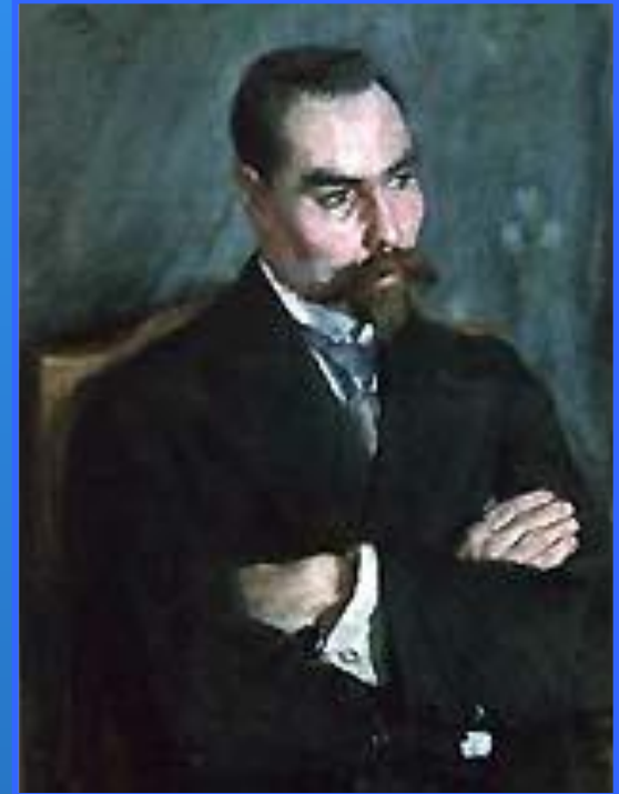
В. Я. Брюсов

Сочиняя стихи с 11 лет и печатаясь с 18 лет (первая публикация — в издававшемся Гумилевым в Париже журнале «Сириус», 1907), Ахматова впервые огласила свои опыты перед авторитетной аудиторией летом 1910. Отстаивая с самого начала семейной жизни духовную самостоятельность, она делает попытку напечататься без помощи Гумилева — осенью 1910 посылает стихи в «Русскую мысль» В. Я. Брюсову, спрашивая, стоит ли ей заниматься поэзией, затем отдает стихи в журналы «Gaudeamus», «Всеобщий журнал», «Аполлон», которые, в отличие от Брюсова, их публикуют. По возвращении Гумилева из африканской поездки (март 1911) Ахматова читает ему все сочиненное за зиму и впервые получает полное одобрение своим литературным опытам. С этого времени она становится профессиональным литератором.