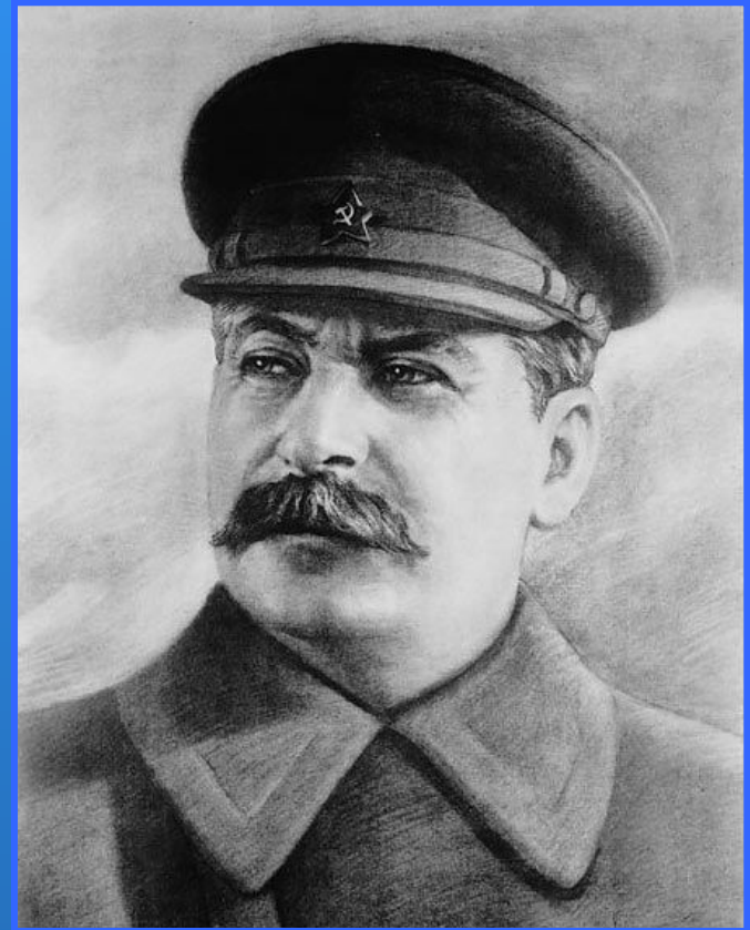
Сталин И. В.

В 1945-46 Ахматова навлекает на себя гнев Сталина, узнавшего о визите к ней английского историка И. Берлина. Кремлевские власти делают Ахматову наряду с М. М. Зощенко главным объектом партийной критики; направленное против них постановление ЦК ВКП(б) «О журналах «Звезда» и «Ленинград» (1946) ужесточило идеологический диктат и контроль над советской интеллигенцией, введенной в заблуждение раскрепощающим духом всенародного единства во время войны. Снова возник запрет на публикации; исключение было сделано в 1950, когда Ахматова сымитировала верноподданнические чувства в своих стихах, написанных к юбилею Сталина в отчаянной попытке смягчить участь сына, в очередной раз подвергшегося заключению.