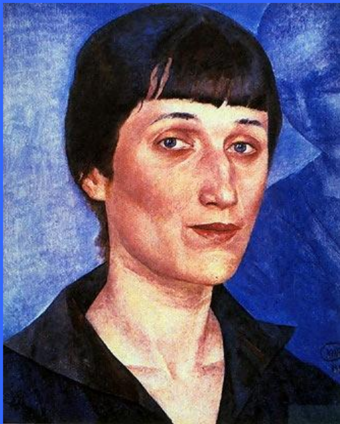
Ахматова Анна Андреевна (портрет работы К. С. Петрова-Водкина)