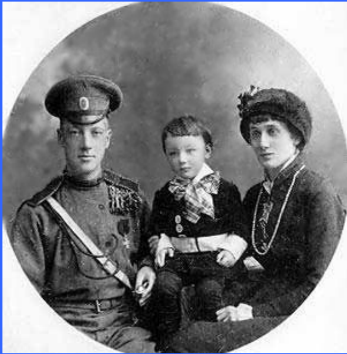
Ахматова и Гумилев с сыном