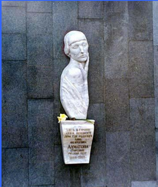
Одесса. Мемориальная доска А. А. Ахматовой на доме на Большом Фонтане, где родилась поэтесса