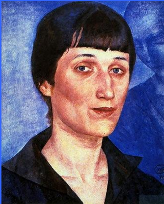
Ахматова Анна Андреевна (портрет работы К. С. Петрова-Водкина)