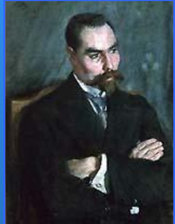
В. Я. Брюсов

Сочиняя стихи с 11 лет и печатаясь с 18 лет (первая публикация — в издававшемся Гумилевым в Париже журнале «Сириус», 1907), Ахматова впервые огласила свои опыты перед авторитетной аудиторией летом 1910. Отстаивая с самого начала семейной жизни духовную самостоятельность, она делает попытку напечататься без помощи Гумилева — осенью 1910 посылает стихи в «Русскую мысль» В. Я. Брюсову, спрашивая, стоит ли ей заниматься поэзией, затем отдает стихи в журналы «Gaudeamus», «Всеобщий журнал», «Аполлон», которые, в отличие от Брюсова, их публикуют. По возвращении Гумилева из африканской поездки (март 1911) Ахматова читает ему все сочиненное за зиму и впервые получает полное одобрение своим литературным опытам. С этого времени она становится профессиональным литератором.