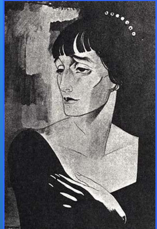
Ю. П. Анненков. «Анна Ахматова»

С началом Первой мировой войны Ахматова резко ограничивает свою публичную жизнь. В это время она страдает от туберкулеза, болезни, долго не отпускавшей ее. Углубленное чтение классики (А. С. Пушкин, Е. А. Баратынский и др.) сказывается на ее поэтической манере, остропарадоксальный стиль беглых психологических зарисовок уступает место неоклассицистическим торжественным интонациям. Проницательная критика угадывает в ее сборнике «Белая стая» (1917) нарастающее «ощущение личной жизни как жизни национальной, исторической» (Б. М. Эйхенбаум). Инспирируя в ранних стихах атмосферу «загадки», ауру автобиографического контекста, Ахматова вводит в высокую поэзию свободное «самовыражение» как стилевой принцип. Кажущаяся фрагментарность, разъятость, спонтанность лирического переживания все явственнее подчиняется сильному интегрирующему началу, что дало повод В. В. Маяковскому заметить: «Стихи Ахматовой монолитны и выдержат давление любого голоса, не дав трещины».