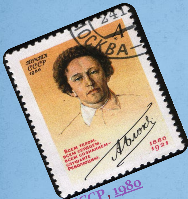
МАРКА СССР, 1980 ГОД