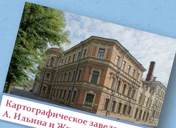
Картографическое заведение А. А. Ильина и Жилой дом

Некоторые здания на улице Александра Блока.