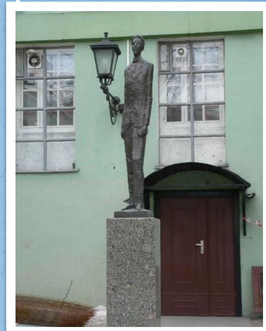
Памятник Александру Блоку во дворе филфака СПбГУ