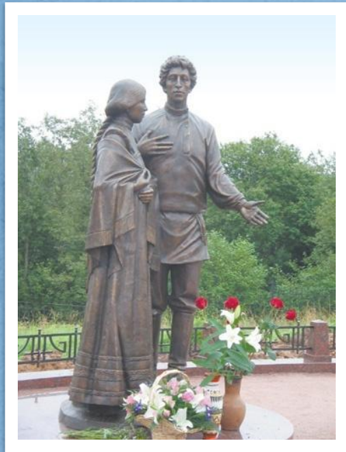
Памятник Блоку: рядом с прекрасной дамой