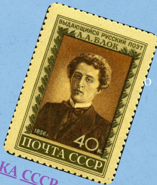
МАРКА СССР, 1956 ГОД