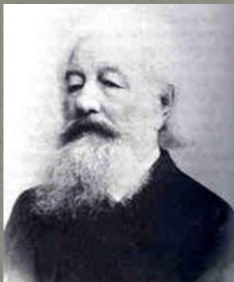
А.Н. Бекетов, дед А.А. Блока. Фотография. 1894 год.