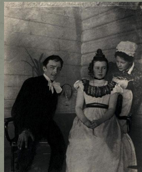
А. Блок в роли Чацкого в любительском спектакле . Боблово. 1898 год.