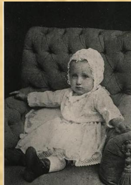
А. Ахматова в детстве