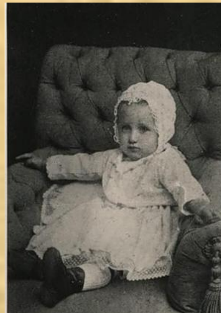
А. Ахматова в детстве