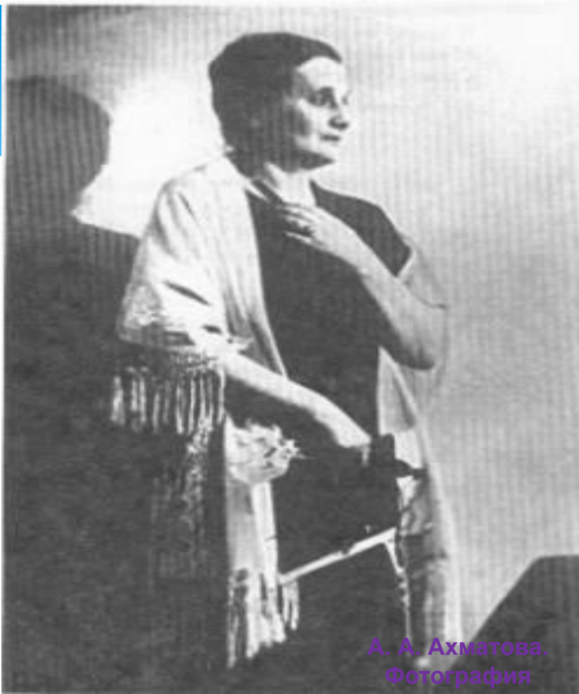
А. А. Ахматова. Фотография