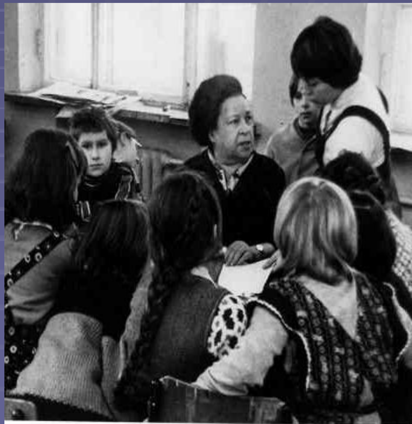
Агния Барто с учащимися школы. 1978 г.