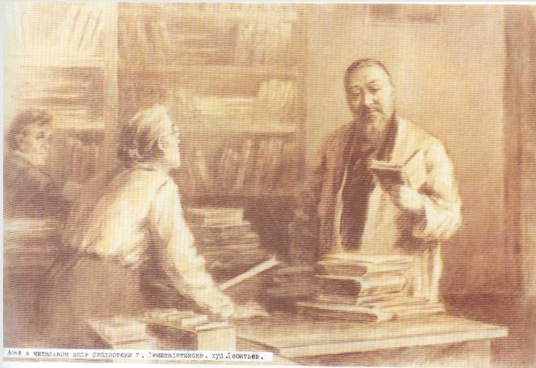
Абай Кунанбаев в Семипалатинской библиотеке