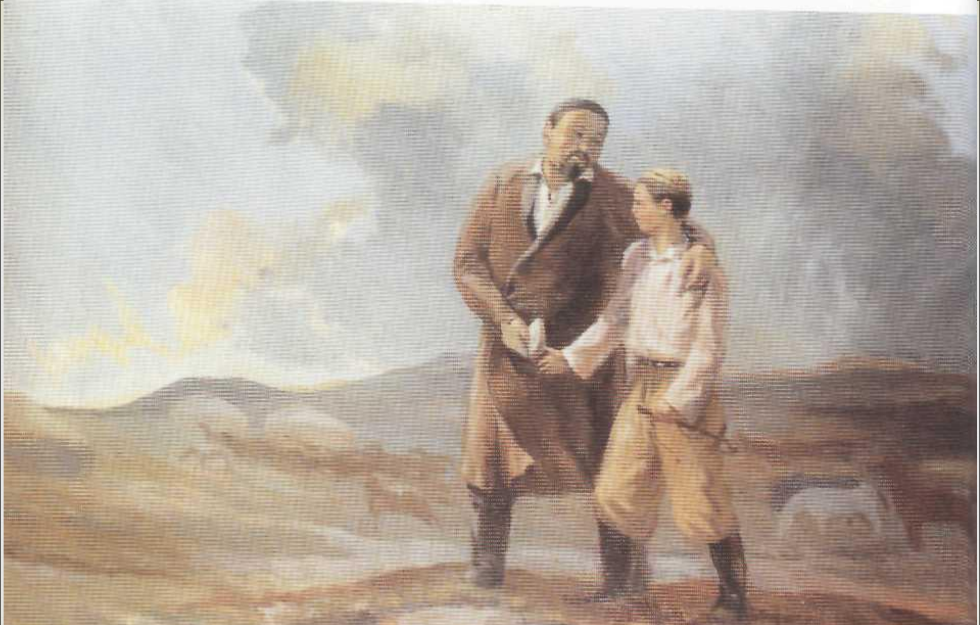
Абай и его сын Магауия