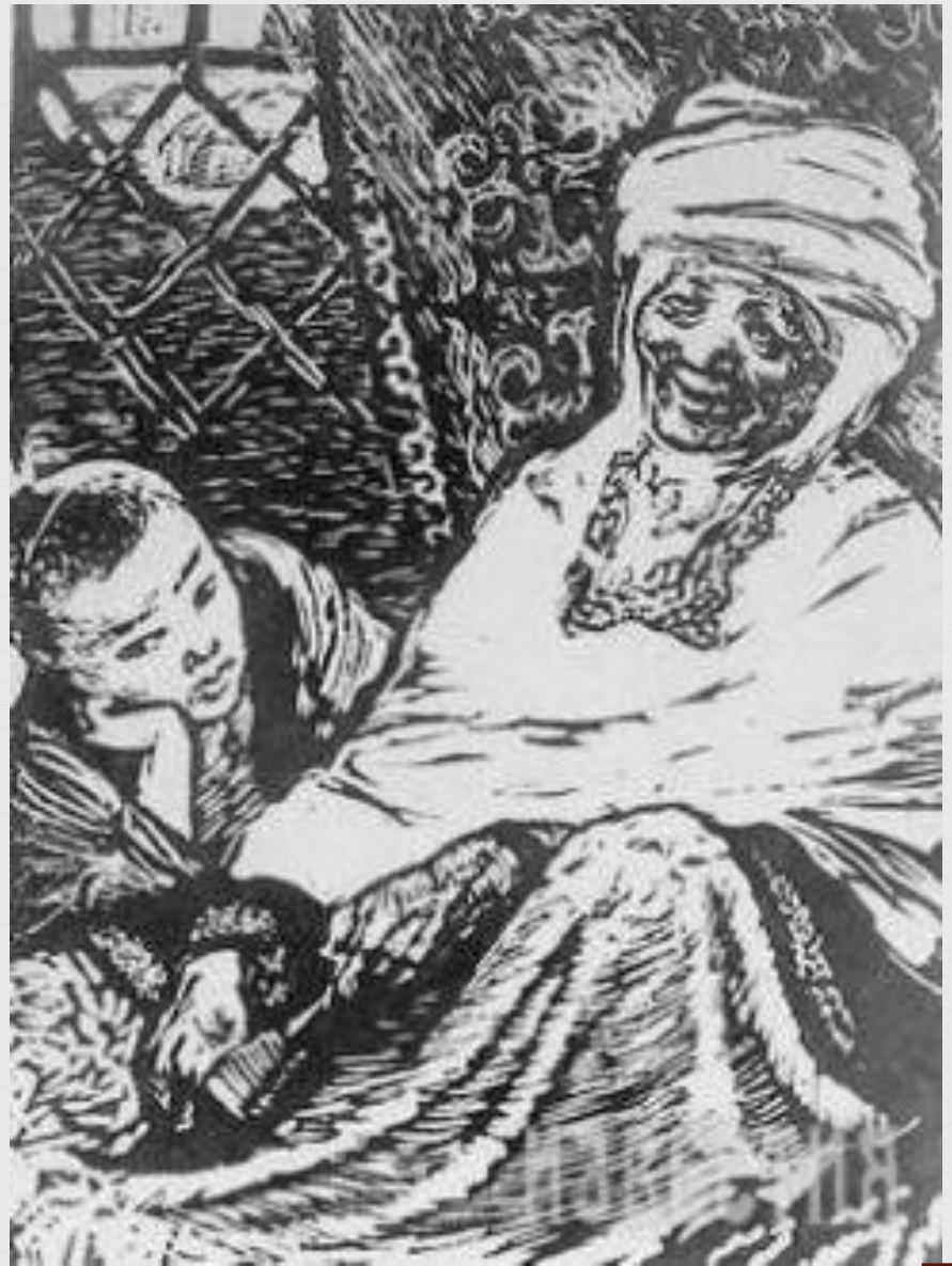
Абай с бабушкой Зере