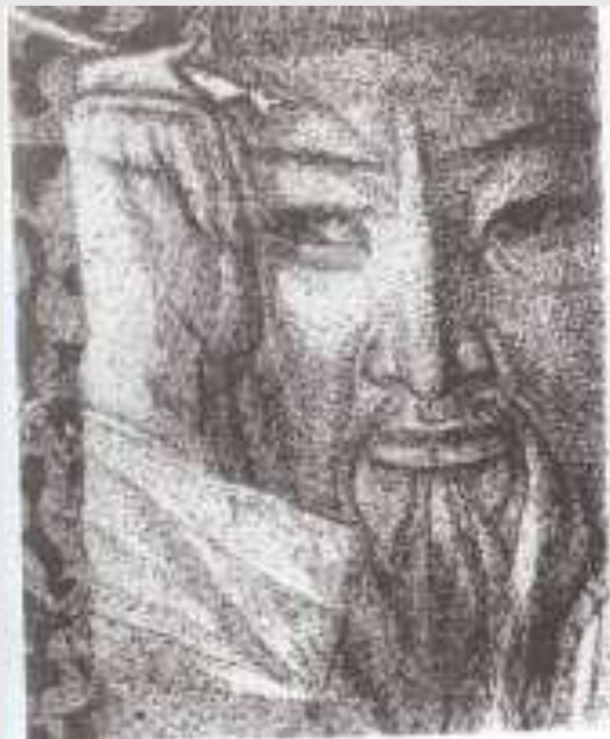
Иллюстрация к роману М. Ауезова «Путь Абая»