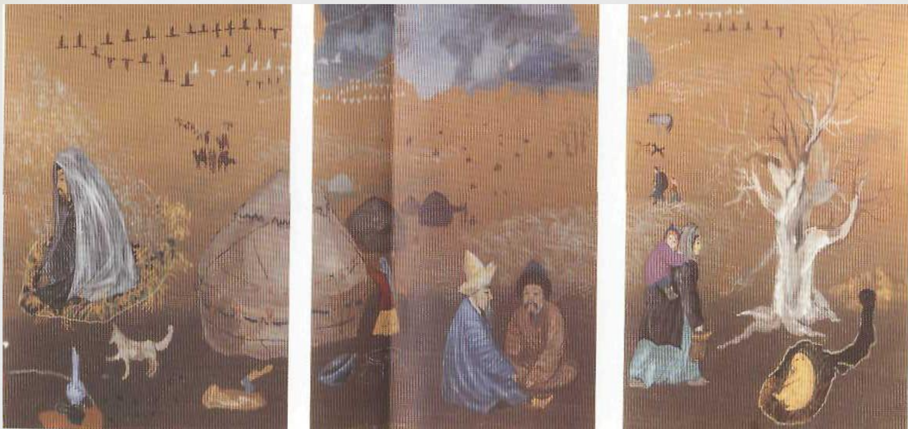
Иллюстрация к произведению «Осень»