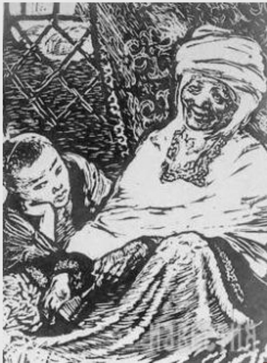
Абай с бабушкой Зере