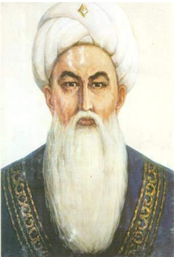
ТӨЛЕ БИ ӘЛІБЕКҮЛЫ TOLE BI ALIBEKULY TOLE BI ALIBEKULY