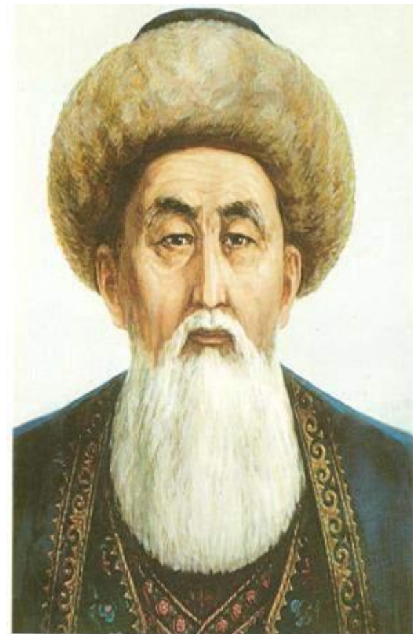
ӘЙТЕКЕ БИ БАЙБЕКҮЛЫ АЙТЕКЕ БИ БАЙБЕКҮЛЫ AITEKE BI BAIBEKULY