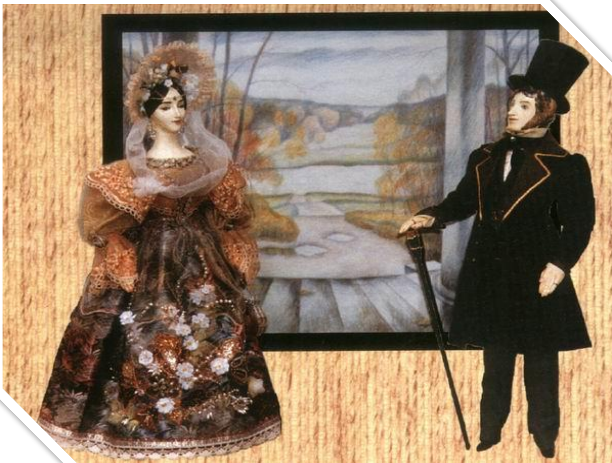
Н.Н.Гончарова и А.С.Пушкин