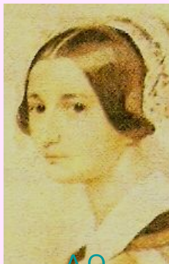
А.О. Смирнова- Россет