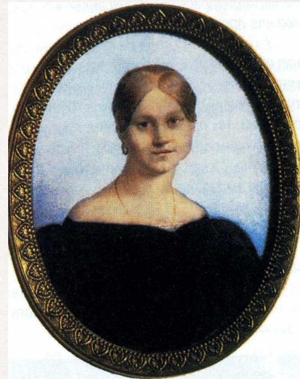
А.П.Керн. Неизвестный художник. 1820-е годы

«К***»1825, «Приметы» 1829, «Когда твои молодые лета...»1829, записи в альбом А.П. Керн