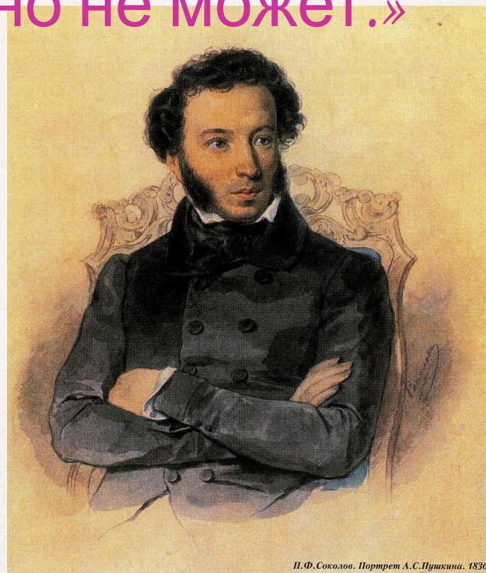
П. Ф. Соколов. Портрет А. С. Пушкина. 1836