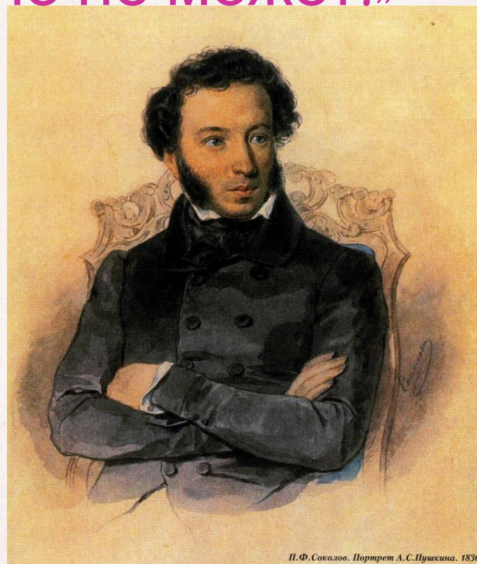
П. Ф. Соколов. Портрет А. С. Пушкина. 1836