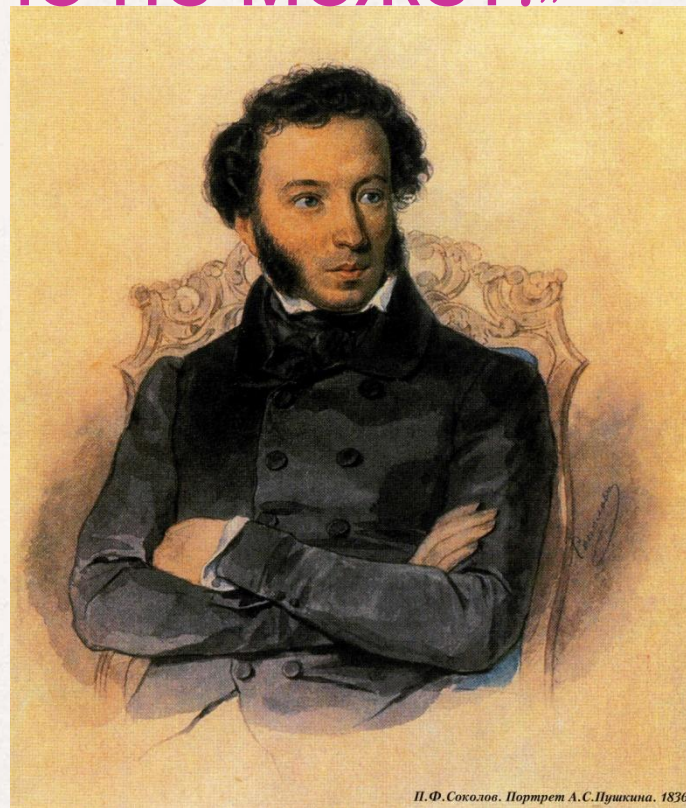
П. Ф. Соколов. Портрет А. С. Пушкина. 1836