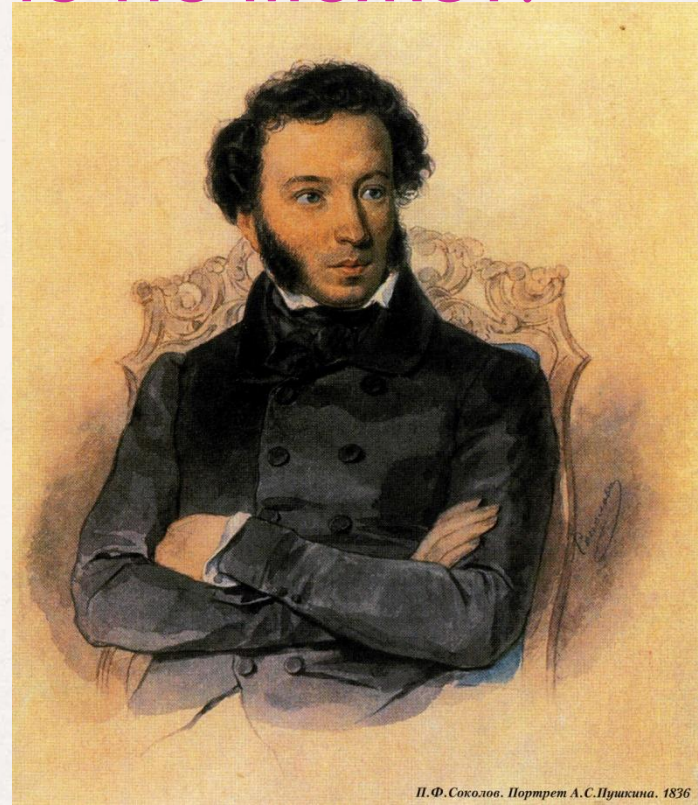
П. Ф. Соколов. Портрет А. С. Пушкина. 1836