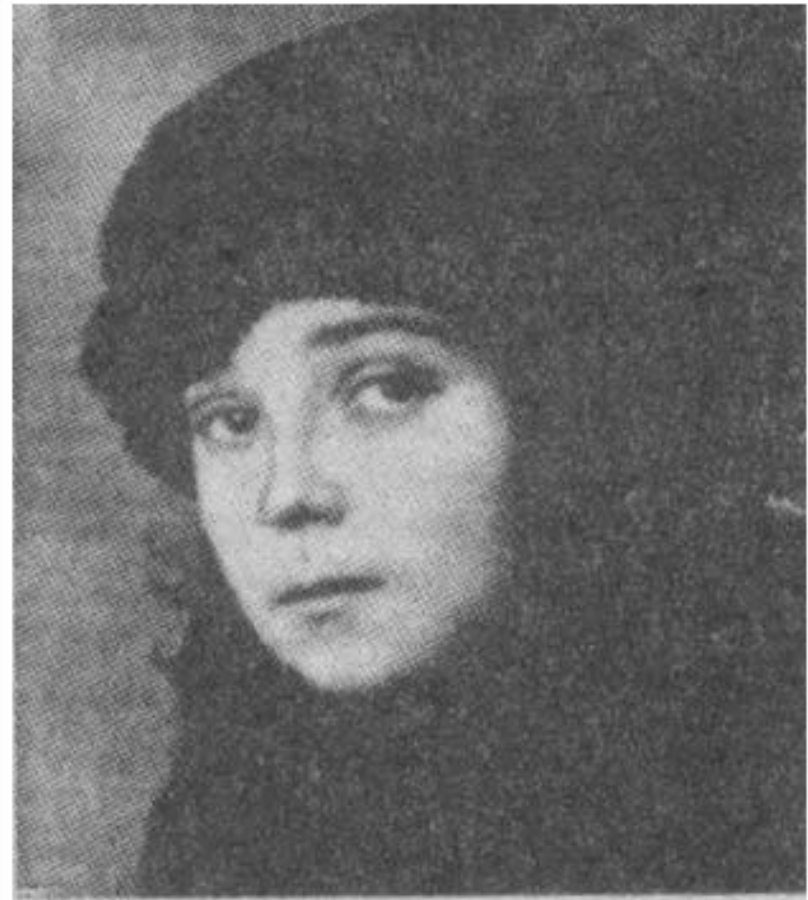
Фотография 1922 года