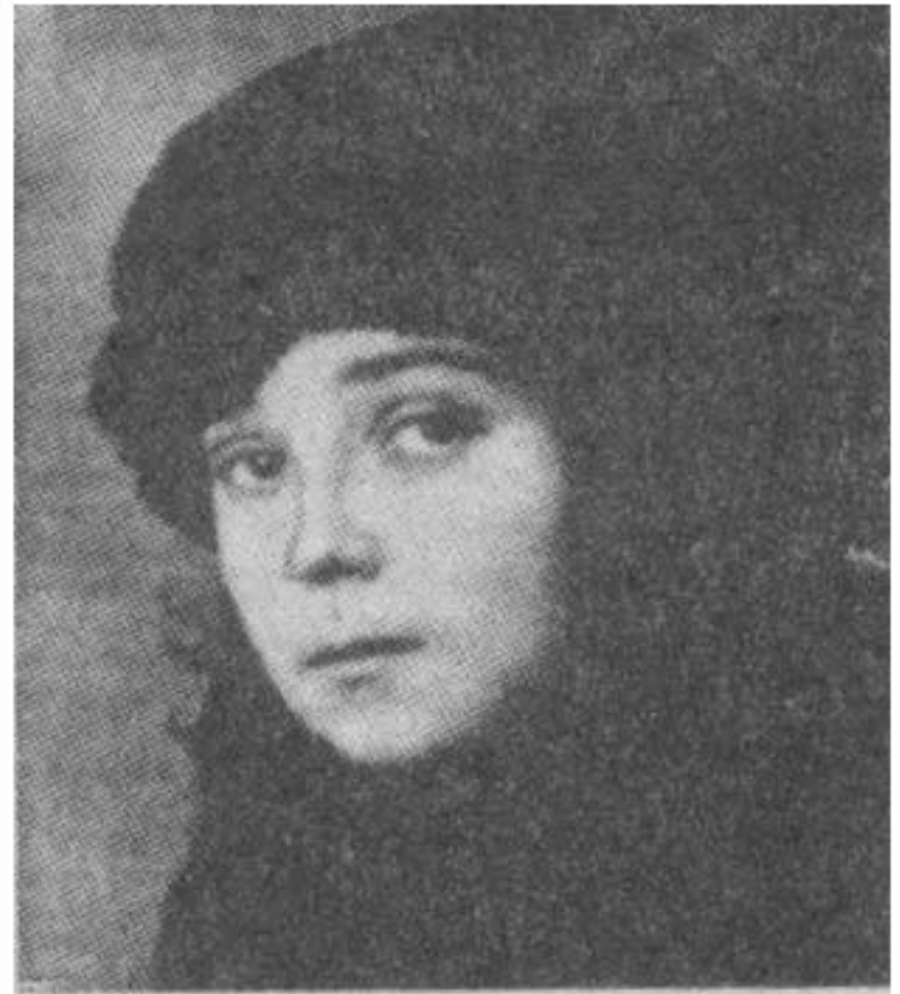
Фотография 1922 года