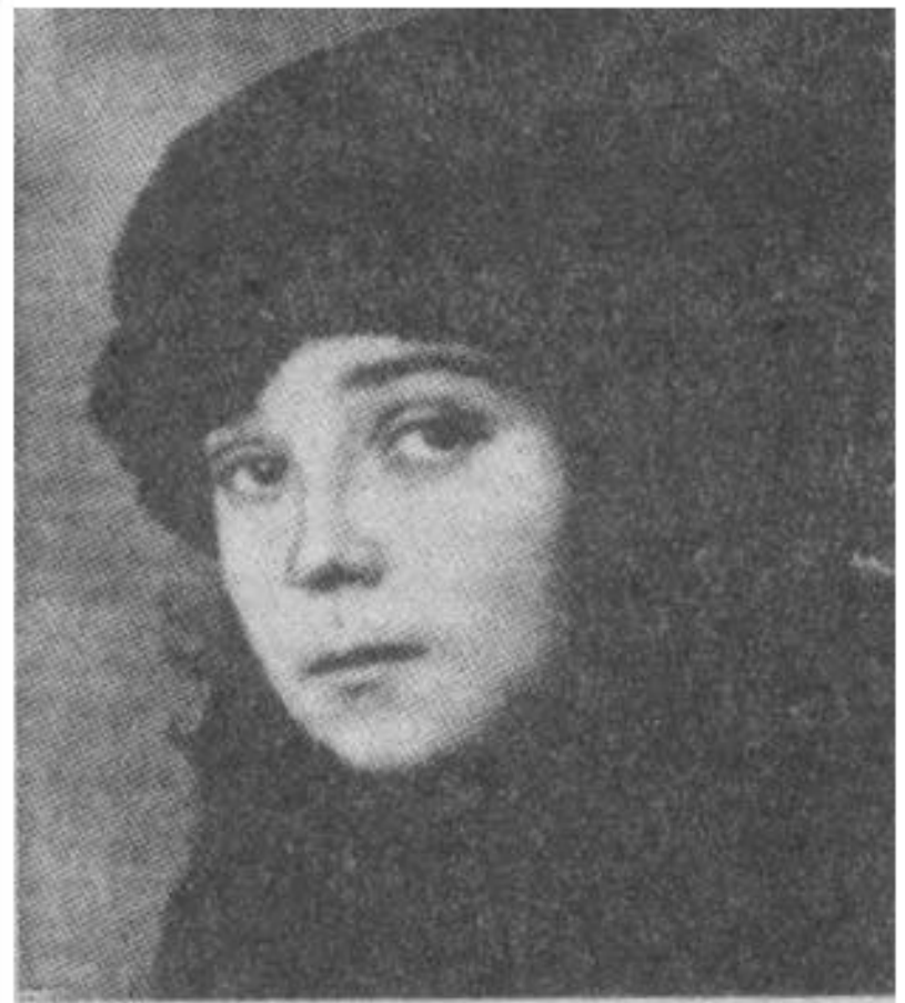
Фотография 1922 года

В годы встречи с Галей Бениславской ( 1920 год ) у Есенина параллельно развивался роман с молодой поэтессой Надеждой Вольпин - ровесницей прошлого века. Целый год Есенин добивался близости этой девушки, был осчастливлен ее девственностью ,и в мае 1924 года, вопреки его воле у Надежды родился сын Александр. Спустя четыре месяца Надежда при случайной встрече на улице приказала няньке перейти на другую сторону - она не позволила Есенину взглянуть на ребенка.