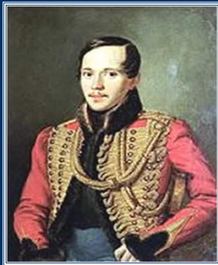
Михаил Юрьевич Лермонтов