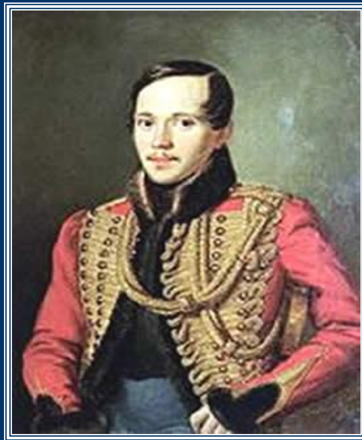
Лермонтов Михаил Юрьевич