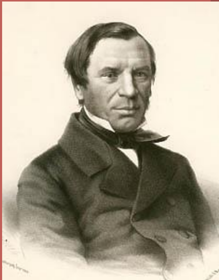
М. П. Погодин