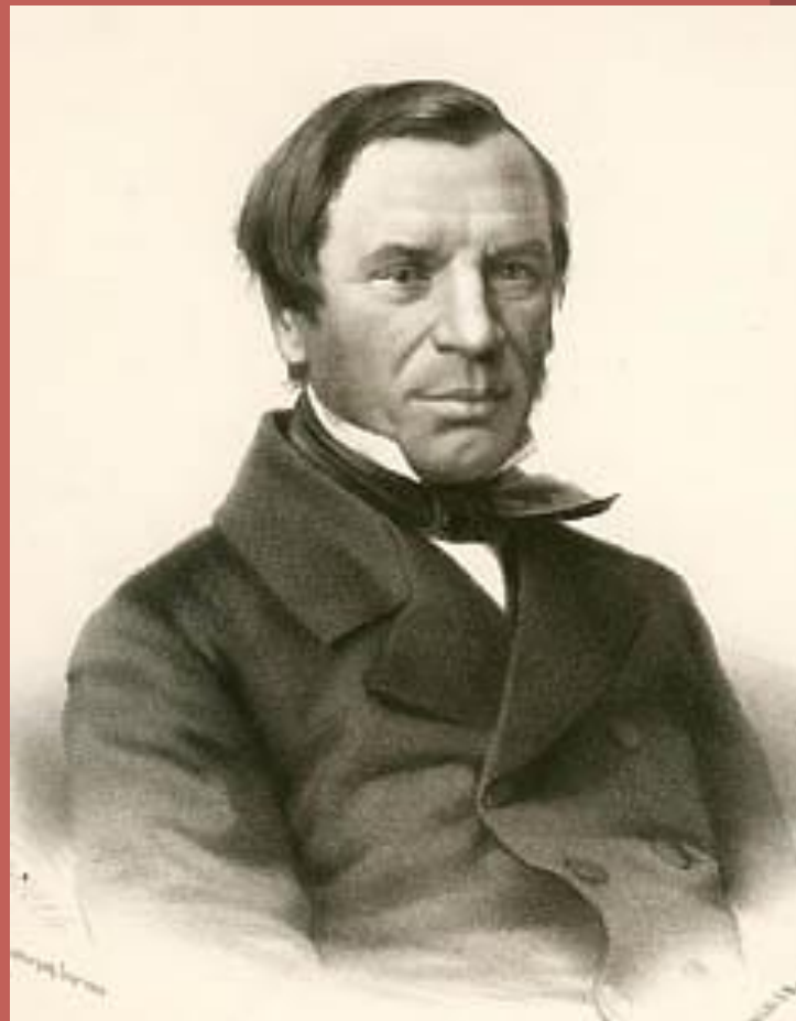
М. П. Погодин

До 14 лет Фет жил и учился дома, а затем в городе Верро (Лифляндский губернии), в пансионе Кроммера. В 1837 г. его перевезли в Москву и поместили у М. П. Погодина; вскоре за тем Афанасий Афанасьевич поступил в Московский университет, на историко-филологический факультет. Почти все студенческое время Фет прожил в семье своего товарища по университету, будущего литературного критика Аполлона Григорьева, имевшего влияние на