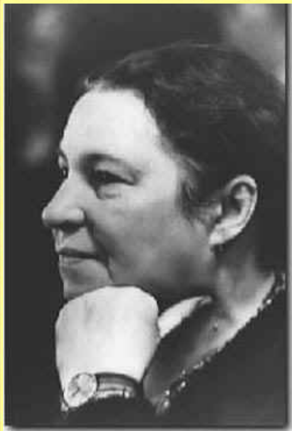
Агния Львовна Барто