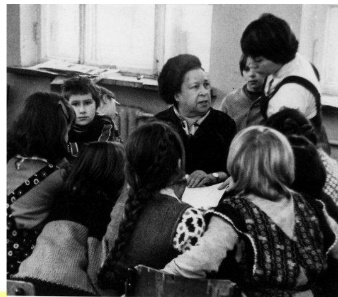
Агния Барто с учащимися школы. 1978 г.