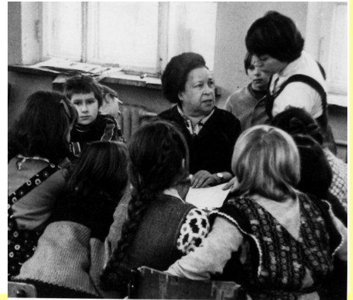
Агния Барто с учащимися школы. 1978 г.