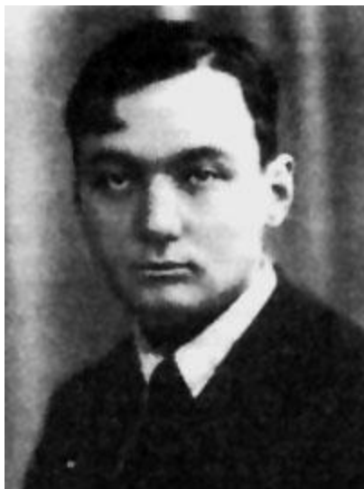
Лев Гумилев, н.30-х гг.