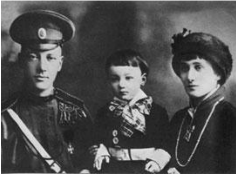
Лев Гумилёв с матерью и отцом

Загорелась игла венчика Вкруг безоблачного лба. Ах! улыбочивого птенчика Подарила мне судьба. Октябрь 1912