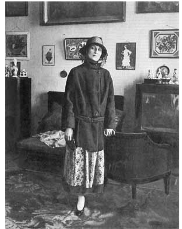
Анна Ахматова. 20-е г. XX в.

А в 1946 г – Второе. Тоже было решено не арестовывать А. Ахматову, но и не печатать.