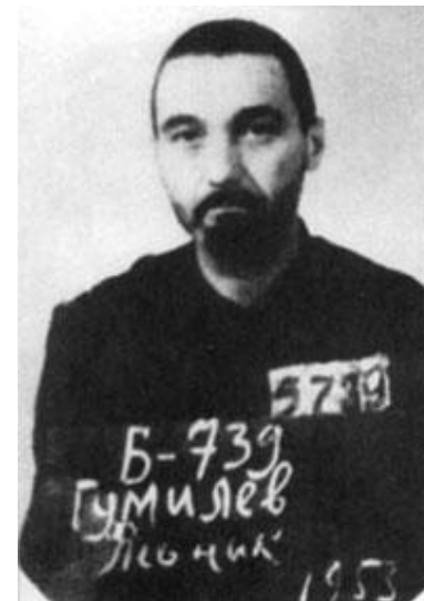
Лев Гумилев в лагере.