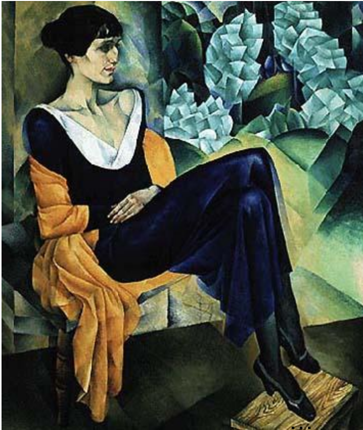
Портрет Анны Ахматовой работы Н.И.Альтмана. 1914 г. Русский музей

...бала художником верного, реалистического зрения.