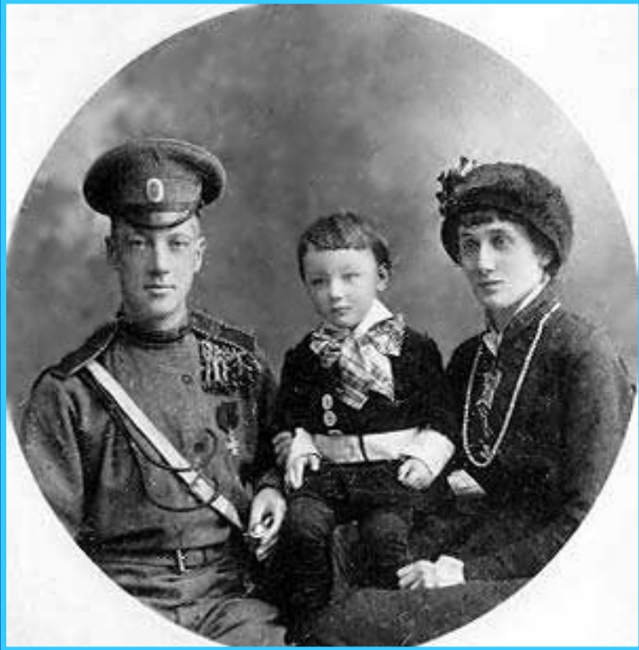
Ахматова и Гумилев с сыном