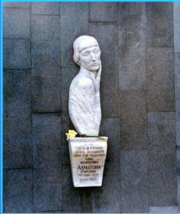
Одесса. Мемориальная доска А. А. Ахматовой на доме на Большом Фонтане, где родилась поэтесса