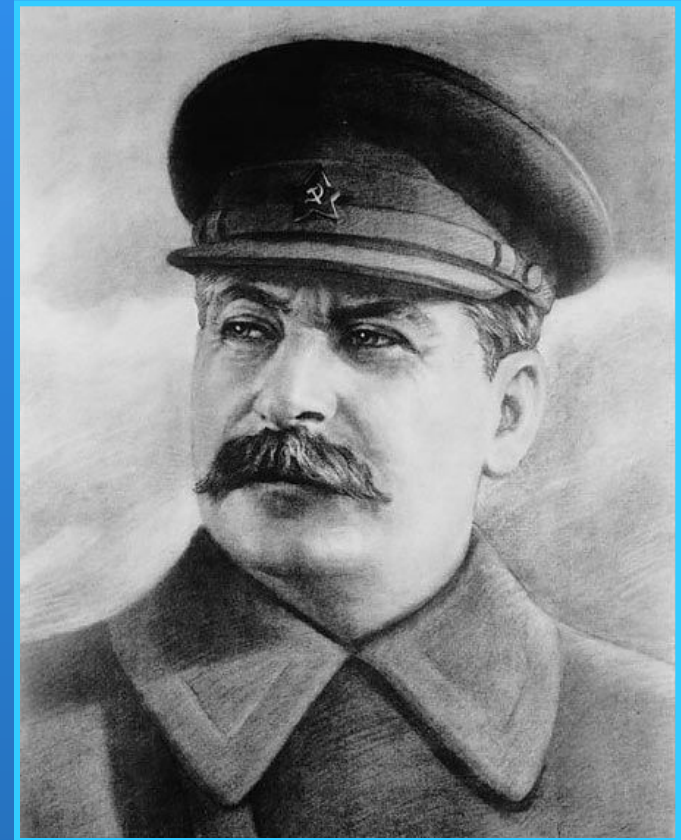
Сталин И. В.

В 1945-46 Ахматова навлекает на себя гнев Сталина, узнавшего о визите к ней английского историка И. Берлина. Кремлевские власти делают Ахматову наряду с М. М. Зощенко главным объектом партийной критики; направленное против них постановление ЦК ВКП(б) «О журналах «Звезда» и «Ленинград» (1946) ужесточило идеологический диктат и контроль над советской интеллигенцией, введенной в заблуждение раскрепощающим духом всенародного единства во время войны. Снова возник запрет на публикации; исключение было сделано в 1950, когда Ахматова сымитировала верноподданнические чувства в своих стихах, написанных к юбилею Сталина в отчаянной попытке смягчить участь сына, в очередной раз подвергшегося заключению.