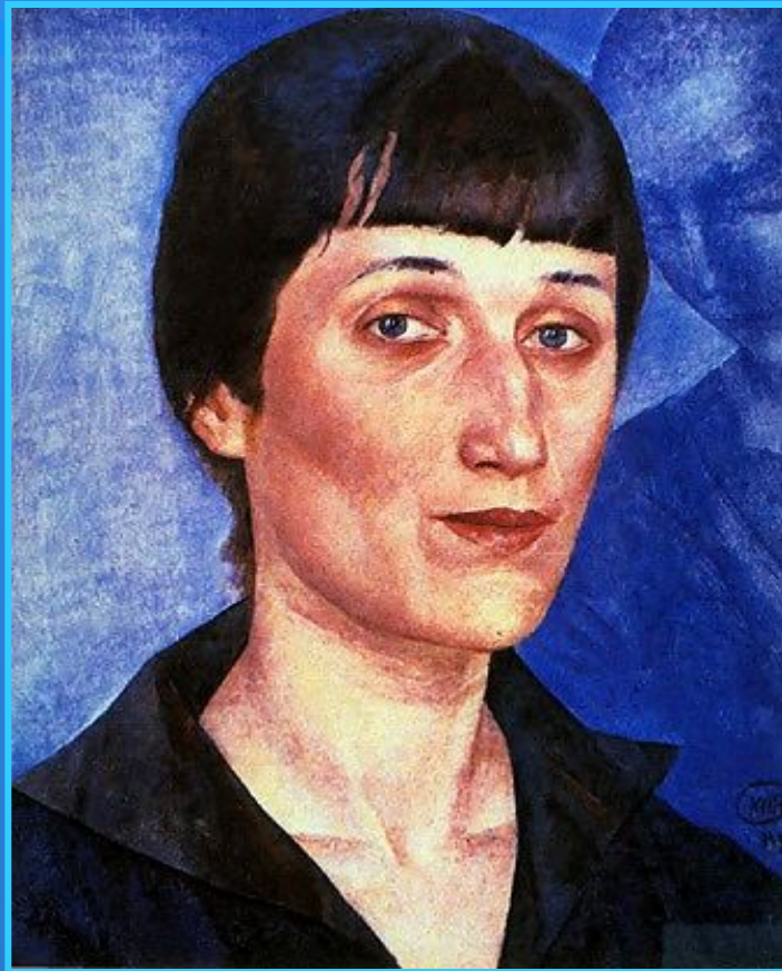
Ахматова Анна Андреевна (портрет работы К. С. Петрова-Водкина)