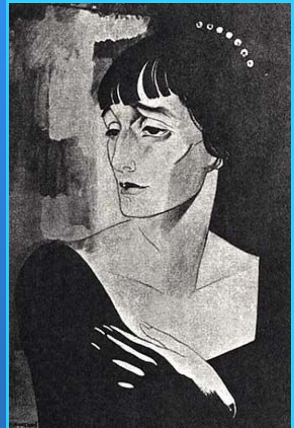
Ю. П. Анненков. «Анна Ахматова»

С началом Первой мировой войны Ахматова резко ограничивает свою публичную жизнь. В это время она страдает от туберкулеза, болезни, долго не отпускавшей ее. Углубленное чтение классики (А. С. Пушкин, Е. А. Баратынский и др.) сказывается на ее поэтической манере, остропарадоксальный стиль беглых психологических зарисовок уступает место неоклассицистическим торжественным интонациям. Проницательная критика угадывает в ее сборнике «Белая стая» (1917) нарастающее «ощущение личной жизни как жизни национальной, исторической» (Б. М. Эйхенбаум). Инспирируя в ранних стихах атмосферу «загадки», ауру автобиографического контекста, Ахматова вводит в высокую поэзию свободное «самовыражение» как стилевой принцип. Кажущаяся фрагментарность, разъятость, спонтанность лирического переживания все явственнее подчиняется сильному интегрирующему началу, что дало повод В. В. Маяковскому заметить: «Стихи Ахматовой монолитны и выдержат давление любого голоса, не дав трещины».