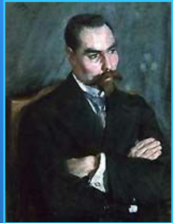
В. Я. Брюсов

Сочиняя стихи с 11 лет и печатаясь с 18 лет (первая публикация — в издававшемся Гумилевым в Париже журнале «Сириус», 1907), Ахматова впервые огласила свои опыты перед авторитетной аудиторией летом 1910. Отстаивая с самого начала семейной жизни духовную самостоятельность, она делает попытку напечататься без помощи Гумилева — осенью 1910 посылает стихи в «Русскую мысль» В. Я. Брюсову, спрашивая, стоит ли ей заниматься поэзией, затем отдает стихи в журналы «Gaudeamus», «Всеобщий журнал», «Аполлон», которые, в отличие от Брюсова, их публикуют. По возвращении Гумилева из африканской поездки (март 1911) Ахматова читает ему все сочиненное за зиму и впервые получает полное одобрение своим литературным опытам. С этого времени она становится профессиональным литератором.