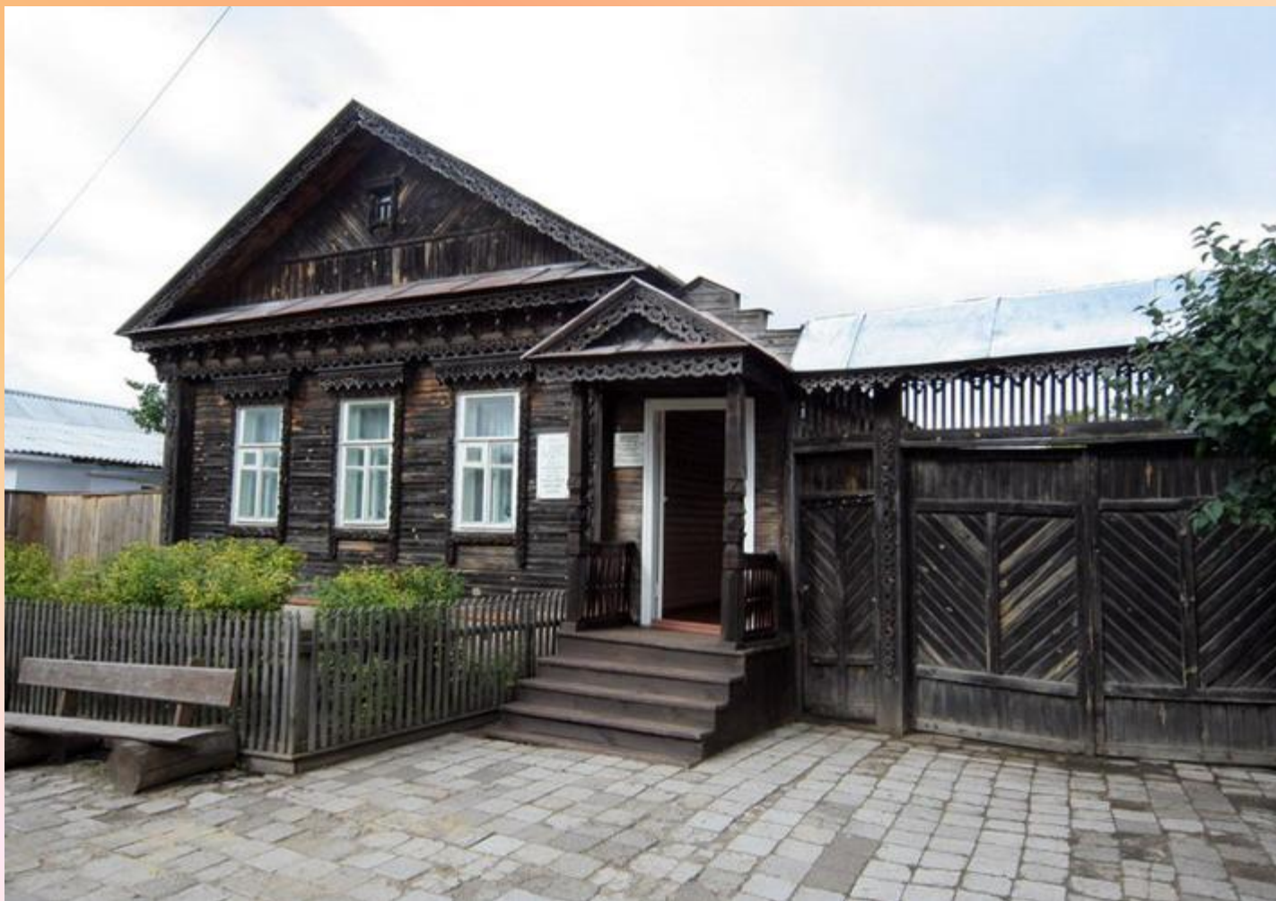
Музей А.И.Куприна в Пензе