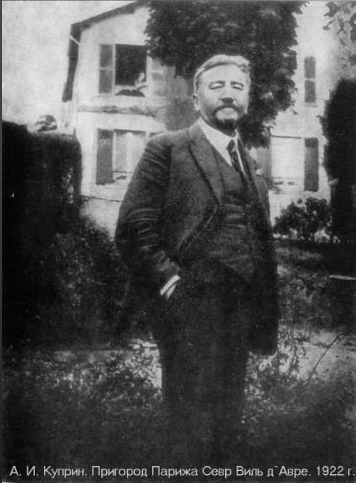
А. И. Куприн. Пригород Парижа Севр Виль д'Авре. 1922 г.