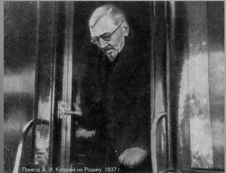
Приезд А. И. Куприна на Родину. 1937 г.