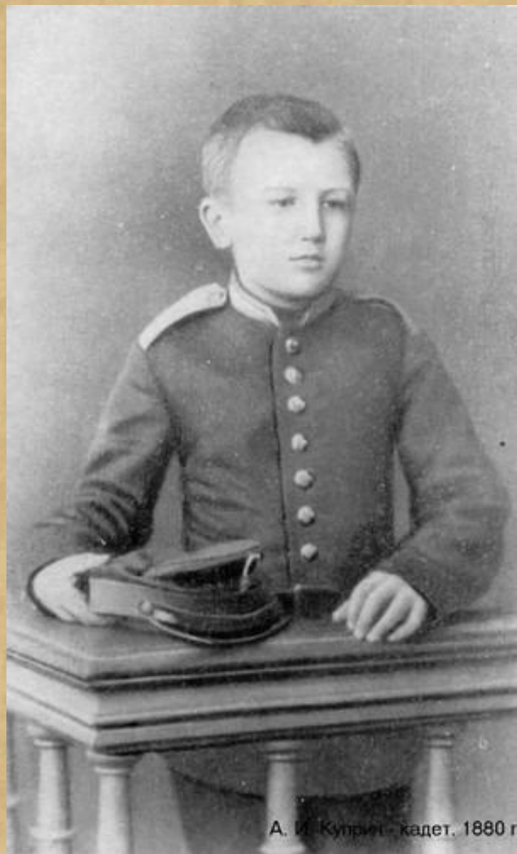
А. И. Куприн - кадет, 1880 г.