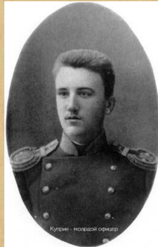
Куприн - молодой офицер

В 1880 году он сдал вступительные экзамены во Вторую московскую военную гимназию, которая два года спустя была преобразована в кадетский корпус.