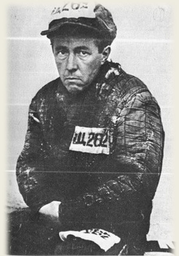
1. Особлаг (сразу по выходе), 1953 г.

В мирное время – студент, в военное – солдат и командир победоносной армии, а потом, при новом взмахе сталинских репрессий, - заключённый.