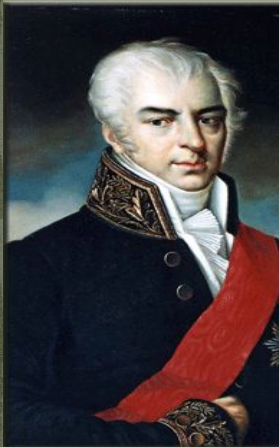
Алексей Кириллович Разумовский, дедушка А.К. Толстого