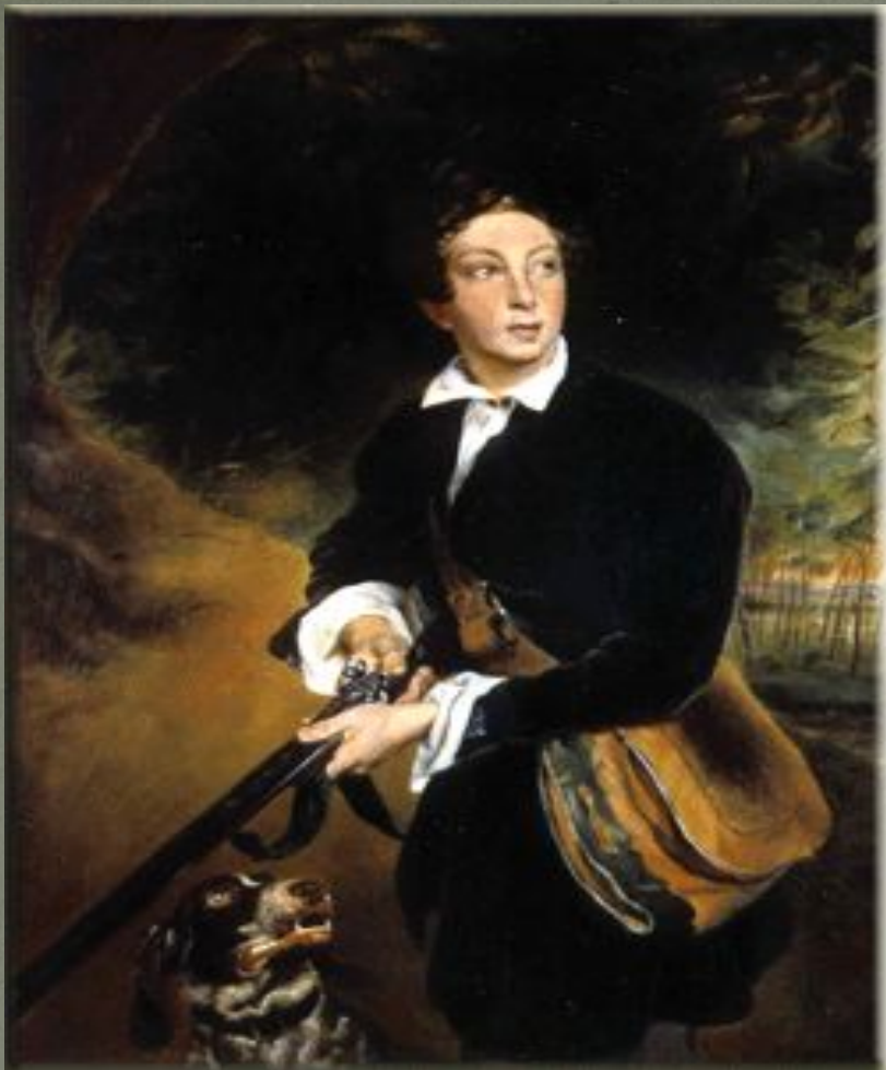
А.Толстой в юности, Худ. К.Брюллов