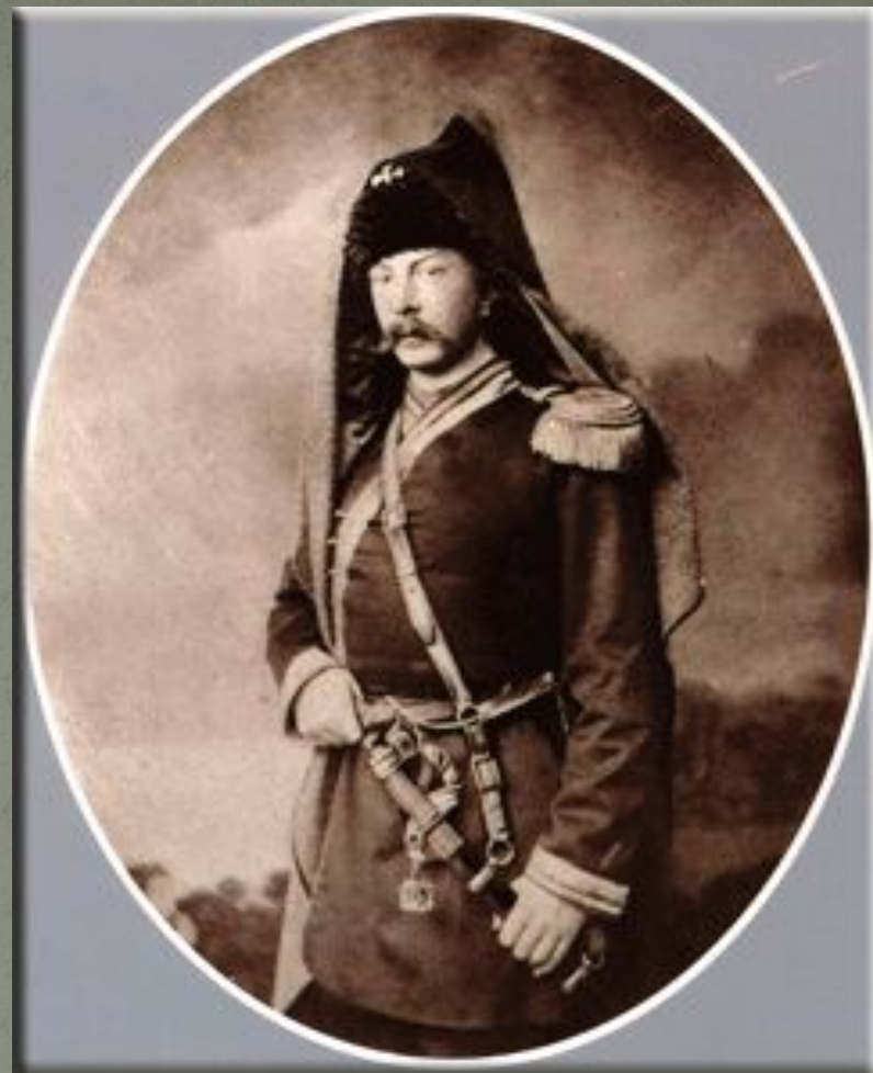
А.К. Толстой в мундире офицера Стрелкового полка, 1855 г.