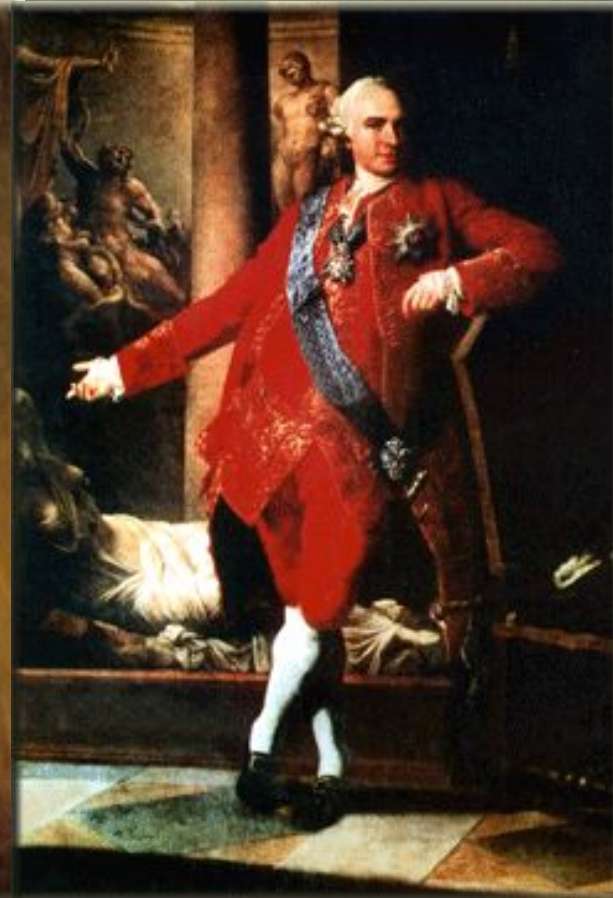
Кирилл Григорьевич Разумовский, прадедушка А.К. Толстого