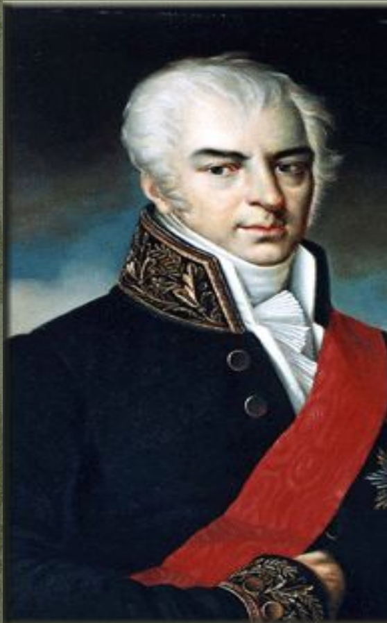
Алексей Кириллович Разумовский, дедушка А.К. Толстого