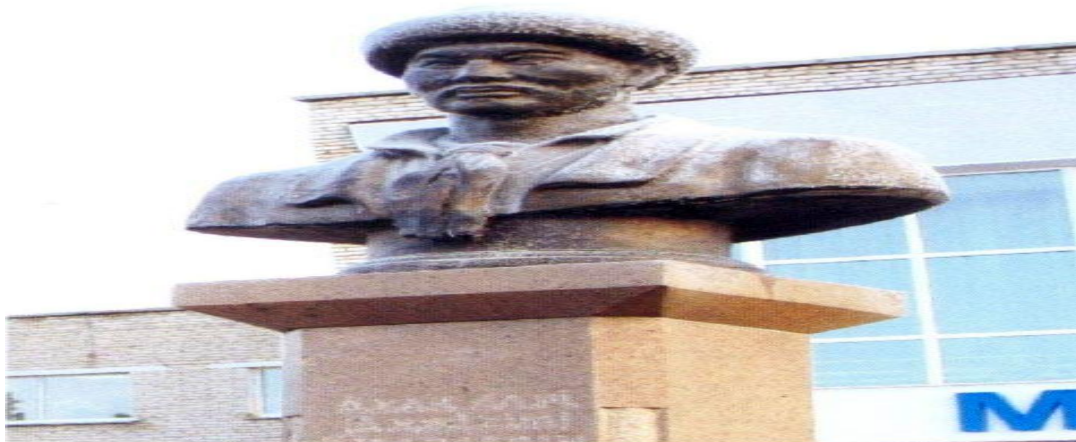
Бюст Ахана Серке, с. Саумалколь Айыртауский район