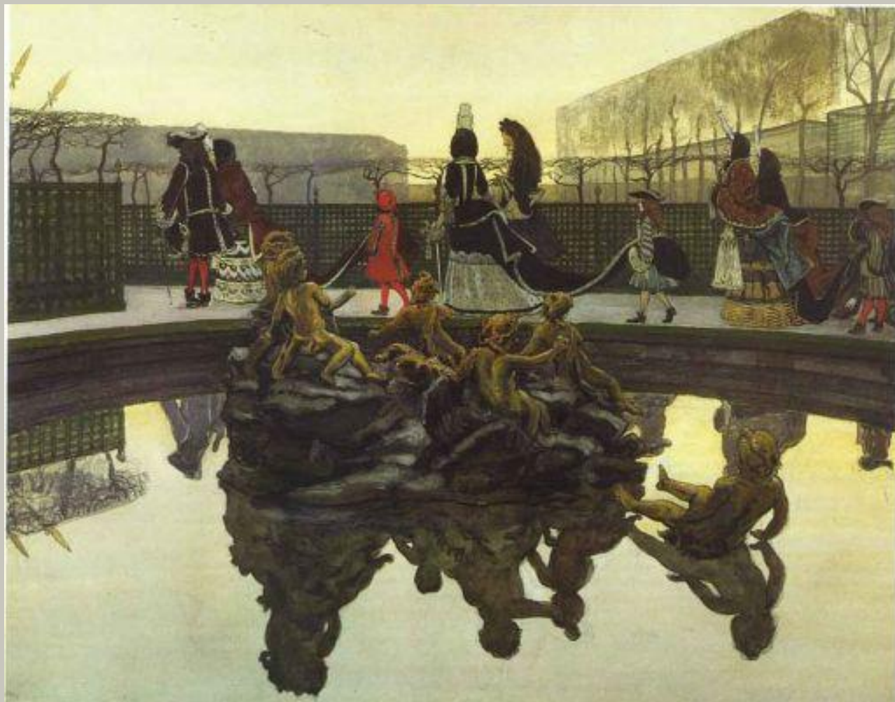
А. Бенуа Прогулка короля