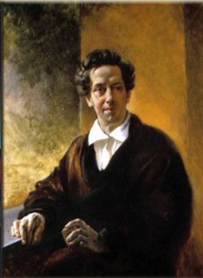
Алексей Алексеевич Перовский, дядя поэта