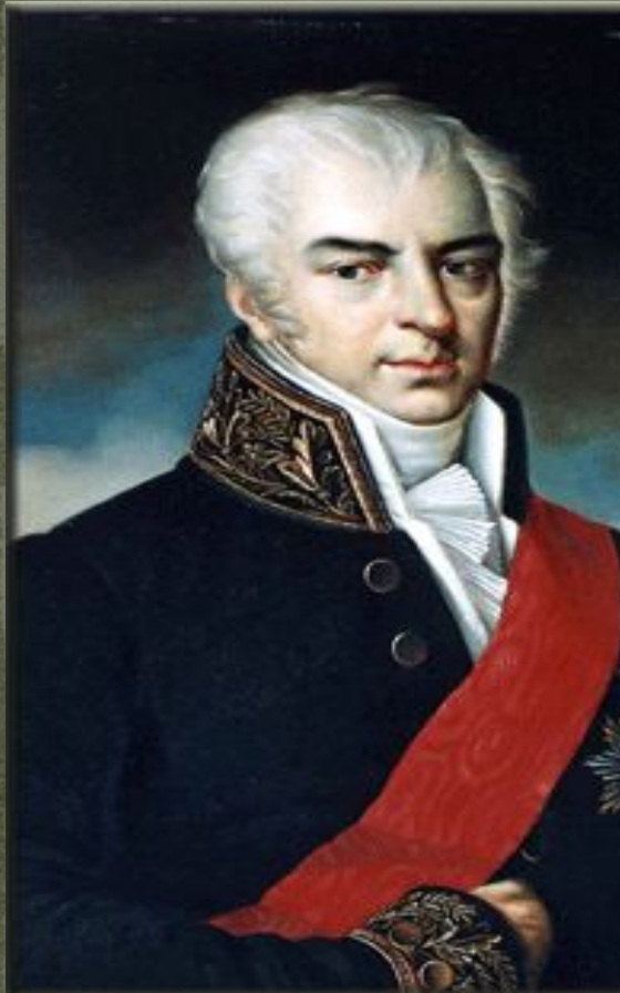
Алексей Кириллович Разумовский, дедушка А.К. Толстого