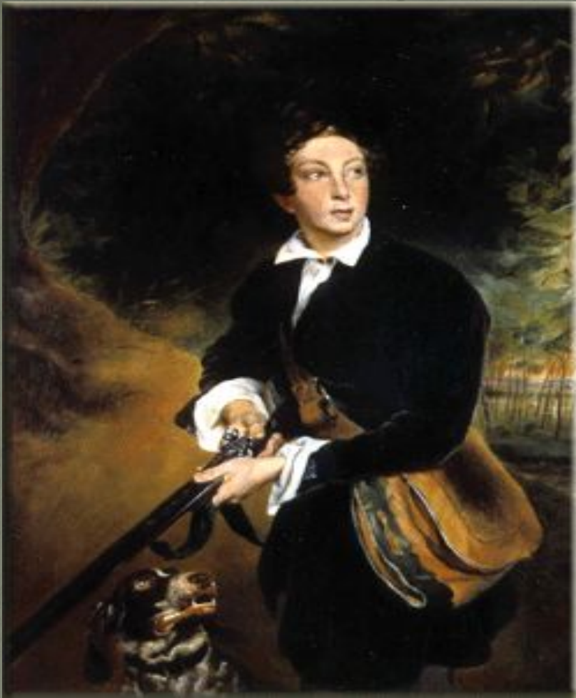
А.Толстой в юности, Худ. К.Брюллов