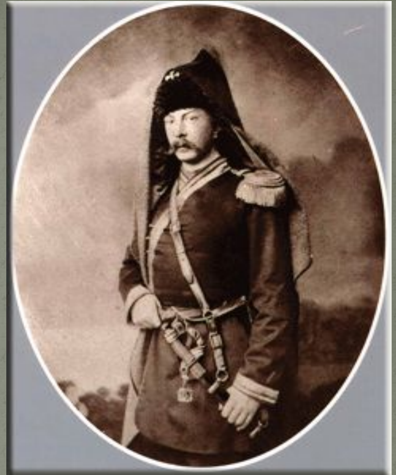
А.К. Толстой в мундире офицера Стрелкового полка, 1855 г.