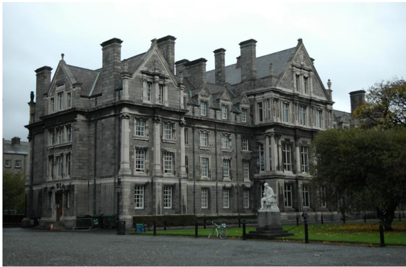
Колледж в Тринити