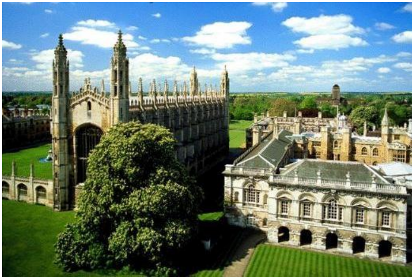
Университет в Кембридже