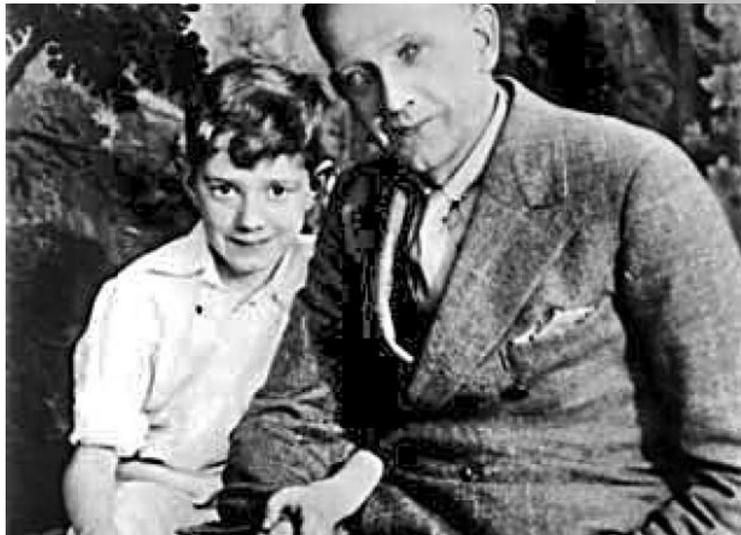
Алан Милн с своим сыном Кристофером Робинем