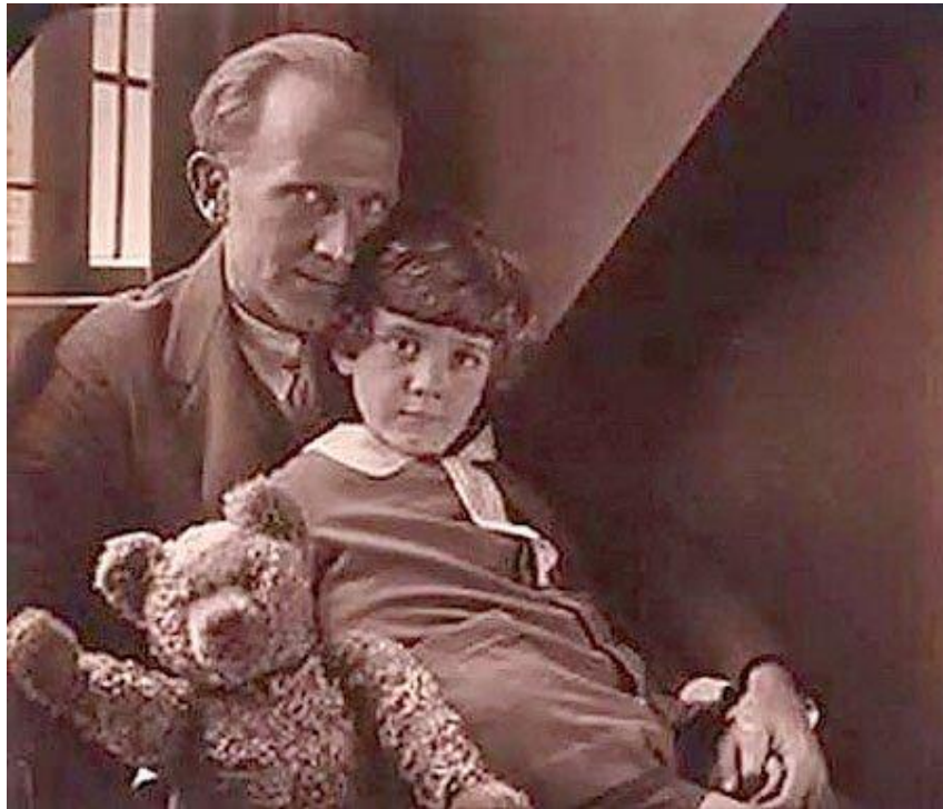
Алан Милн с своим сыном Кристофером Робиним и его любимой игрушкой