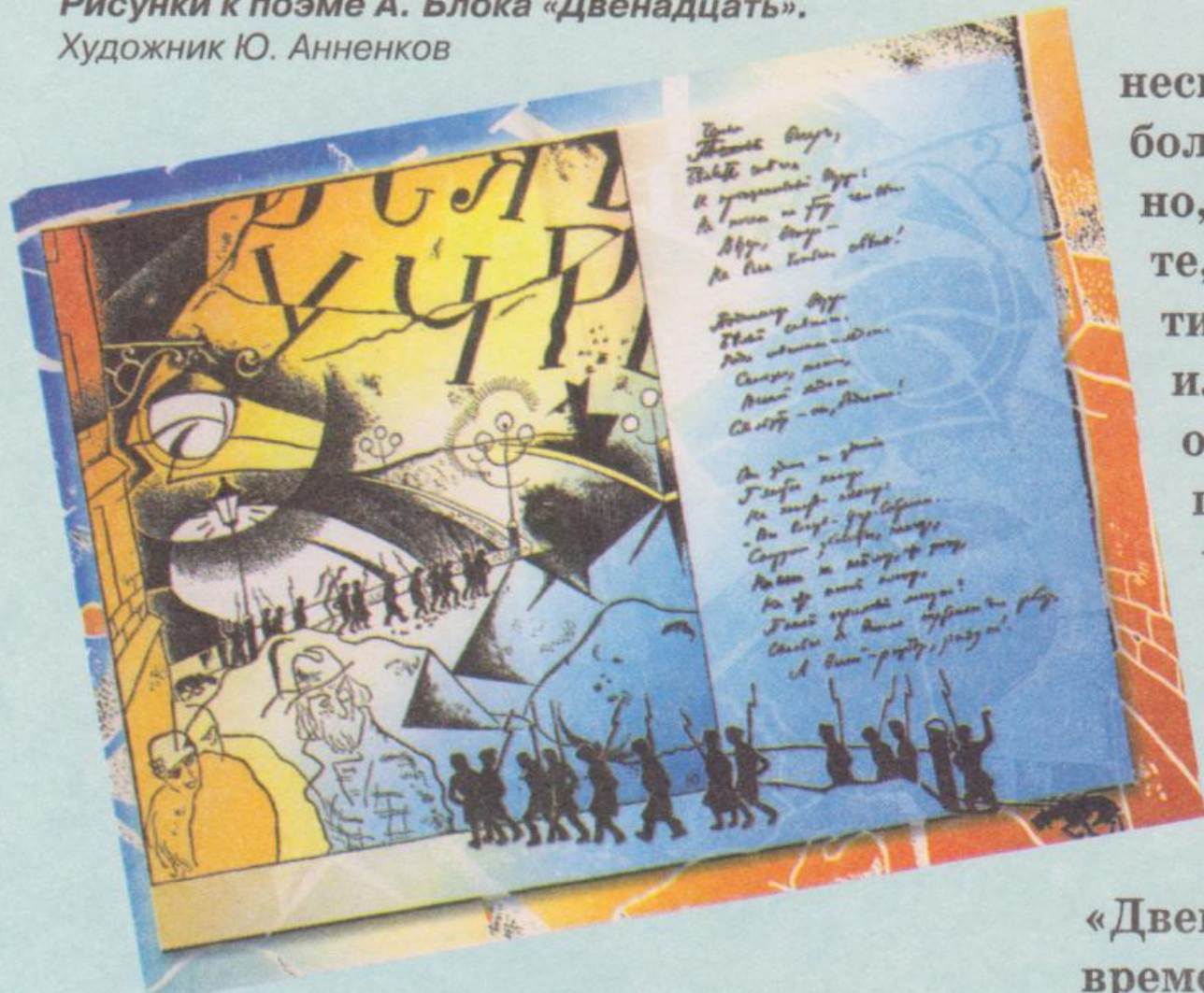
Рисунки к поэме А. Блока «Двенадцать». Художник Ю. Анненков

неско боль но, к те, к тич ил од ги ч к з