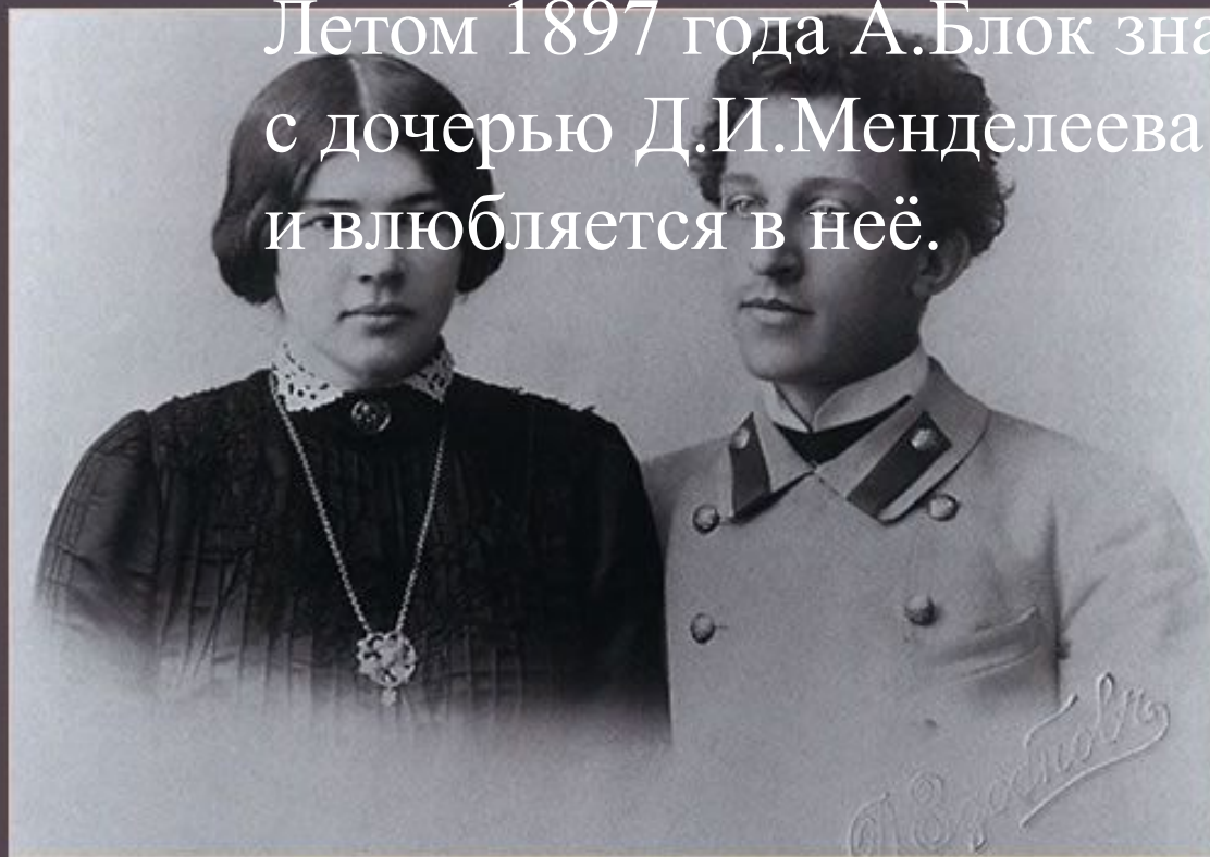
Венчальная фотография, 1903 г.

25 мая 1903 года Александр Блок и Любовь Дмитриевна обручились в университетской церквви, а 17 августа в Боблове состоялась свадьба.