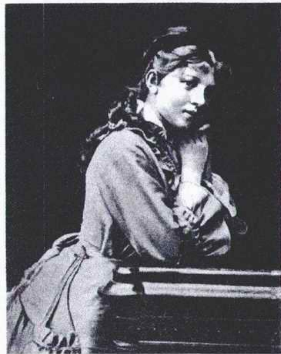
А.А. БЛОК (мать поэта).