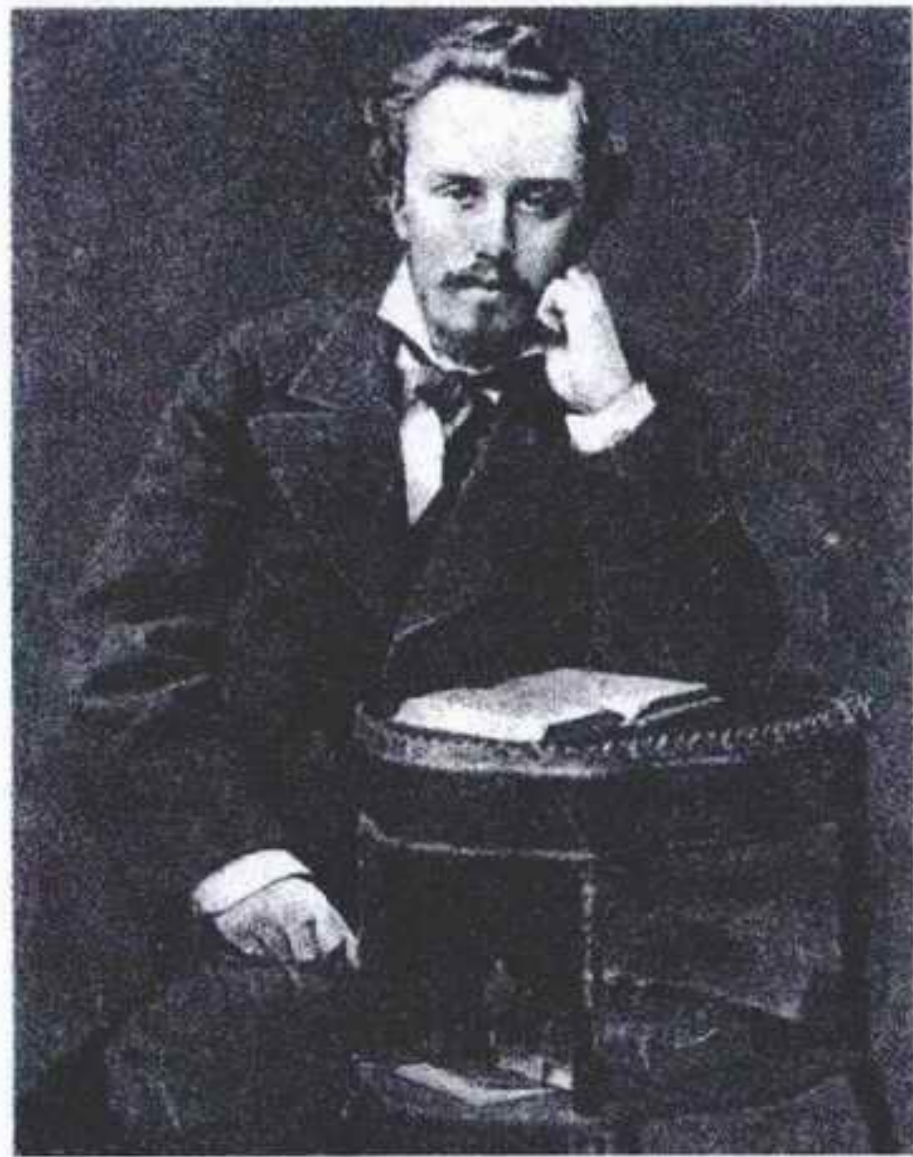
А.Л. БЛОК (отец поэта).