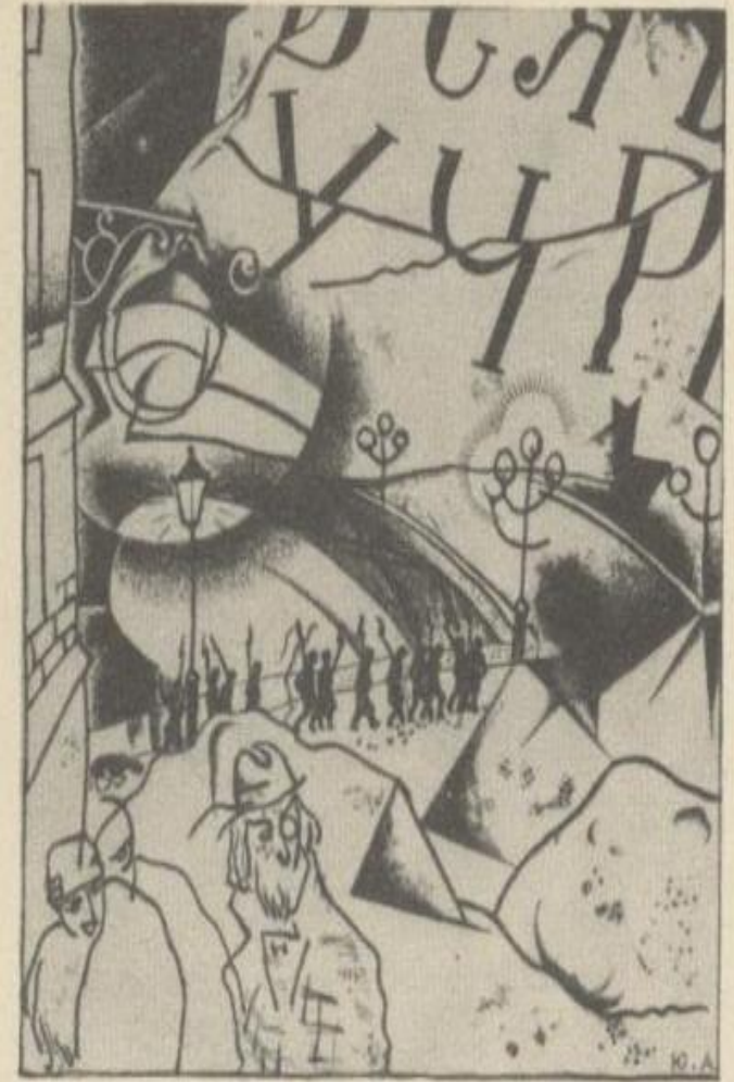
Иллюстрация Ю. Анненкова к поэме «Двенадцать».

Композиционно поэма разбита на двенадцать главок, последовательно развертывающих сюжет. Двенадцать — враги старого мира, но они сами вышли из него, сформировались в его недрах, не могут сразу избавиться от его «родимых пятен». Поэт символически передает это образом старого мира — «пса безродного», который не отстаёт от них, ковыляет позади. В них бушуют и темные страсти. Их охватывает пьянящее ощущение, что «все дозволено»: «Свобода, свобода, эх, эх, без креста!» Поначалу в их облике запечатлены черты не пролетарского авангарда, а анархиствующей вольницы. Автор не «приподнимает» своих героев, показывает грубость и стихийность буйной ватаги. Блок, однако, приветствует происходящее. Он благословляет очистительную силу огня революции и активность ее свершителей: «Мы на горе всем буржуям мировой пожар раздуем!»