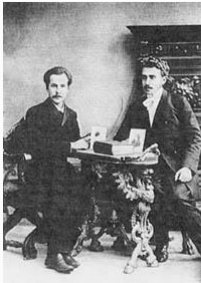
Александр Блок и Андрей Белый

Это и есть то “мгновение слишком яркого света”, о котором Блок писал А. Белому.