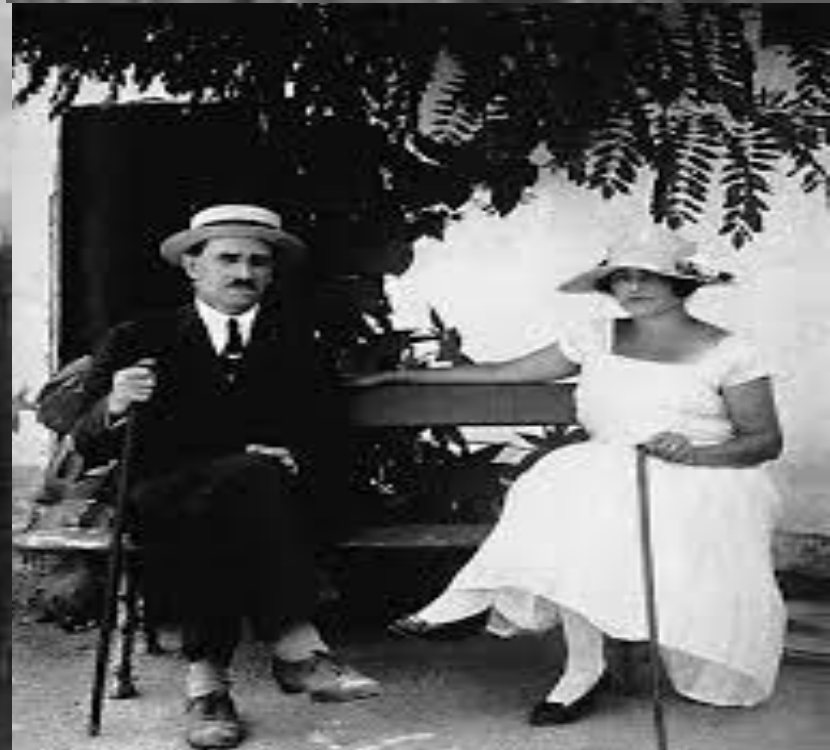
С. П. Шкодин, 1870-е годы. Фото: С. П. Шкодин, 1870-е годы. Фото: С. П. Шкодин, 1870-е годы.